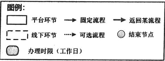
附图1 市本级政府投资项目生成流程图

备注: 【1】所有返回储备库的项目需填写责任部门,待相应建设条件满足或资金来源明确后由责任部门再次启动项目,继续未完成流程。 【2】若涉及城市重点地段或生态敏感区域,各部门可进行标记。 【3】发改部门在下达年度政府投资项目计划决策环节需标记一般项目或特殊项目。