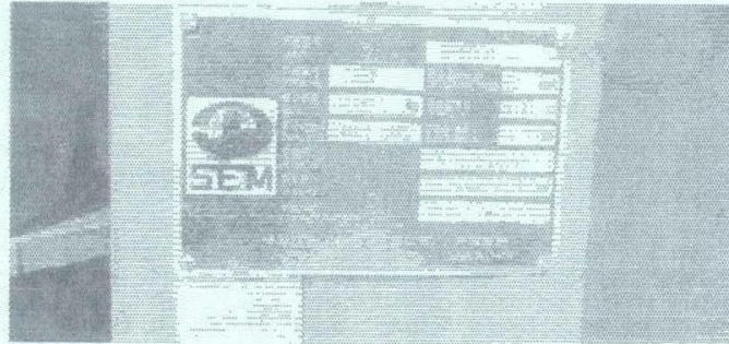
采砂机具 (船舶) 照片