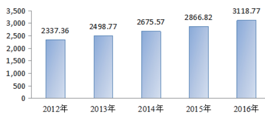
图3 2012-2016年城乡居民人均可支配收入 单位:元

教育文化事业长足发展。教育教学质量大幅提升,高考一本上线率连年位居全省前列,2016年全省高考文理状元花开南阳。公共卫生服务水平不断提升,人民体质不断增强,荣获国家“全民健身示范城市”称号。公共文化服务网络覆盖城乡,文艺精品创作成果丰硕,文化活动丰富多彩,社会主义核心价值观深入人心,“编外雷锋团”“南阳好人”叫响全国。