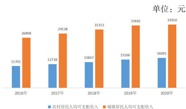
图 2：2016-2020 年居民人均可支配收入

年末参加企业养老保险人数 85.32 万人，其中，职工 62.46 万人，离退休人员 22.86 万人。月参加失业保险人数 59.51 万人，全年累计领取失业保险金人数 0.57 万人。参加城镇职工医疗保险人数 81.28 万人，其中，职工 58.35 万人，退休人员 22.93 万人。