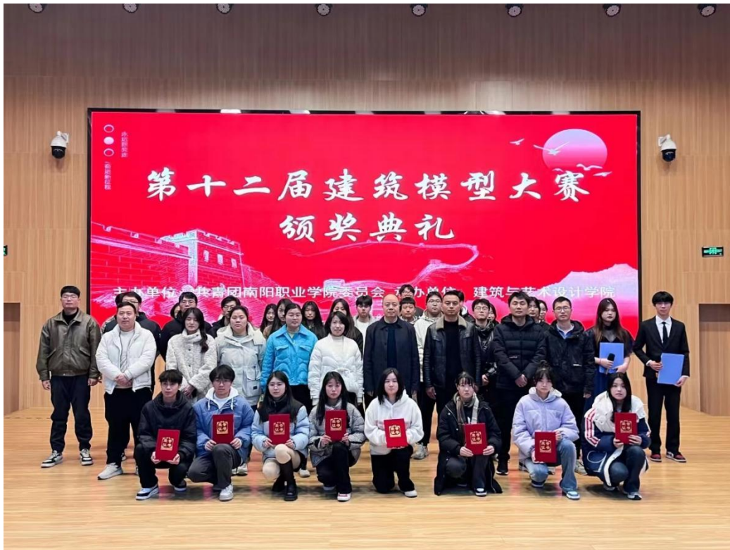
图 “匠心筑梦，技赢未来”第十二届建筑模型大赛