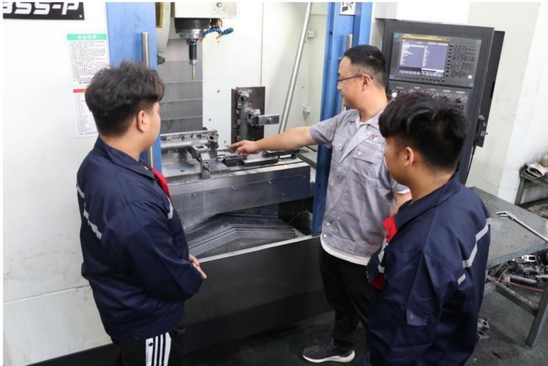
学生在企业进行学习