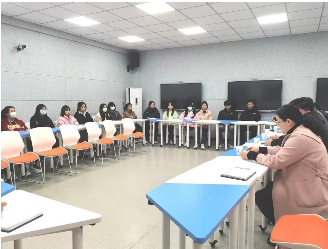
“共话民族情，聚力促前行”铸牢中华民族共同体意识师生座谈会

教育为重点，社会主义核心价值观教育为引领，全面提升思想政治工作水平，提高新形势下学校学生思想政治教育工作的针对性、实效性和吸引力、感染力。