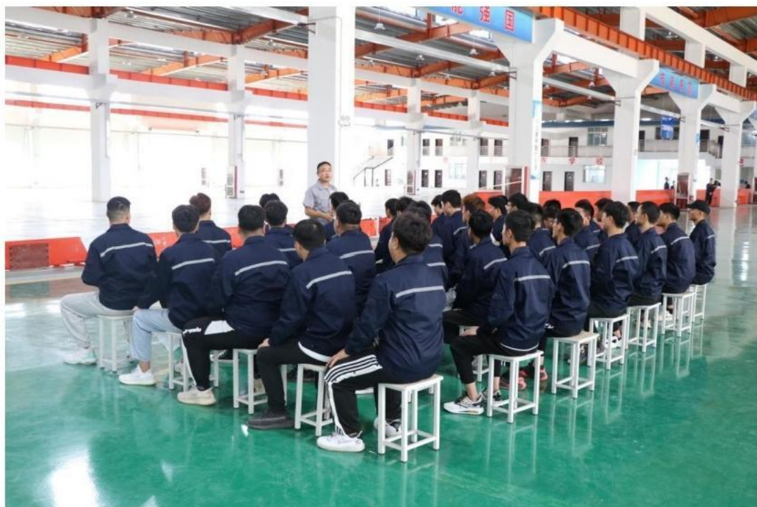
学生进行岗前培训