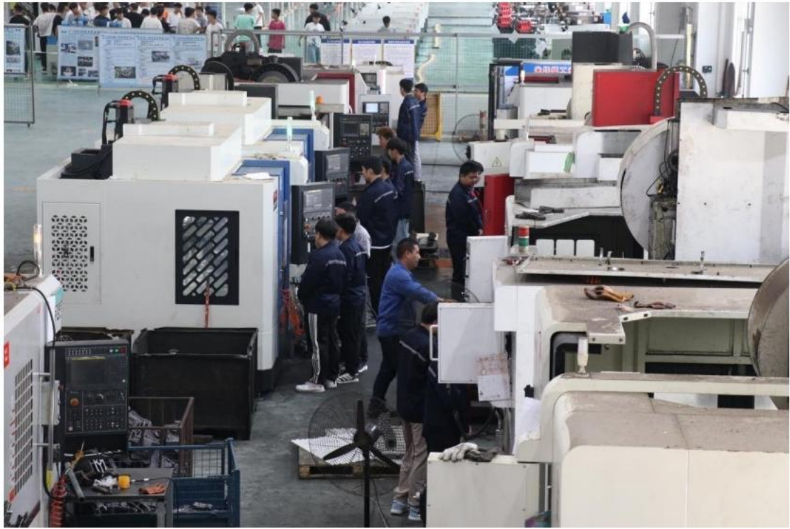
学生在企业进行实际操作