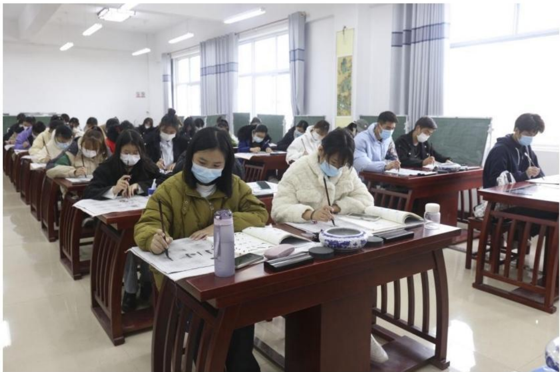
企业进行理论测试