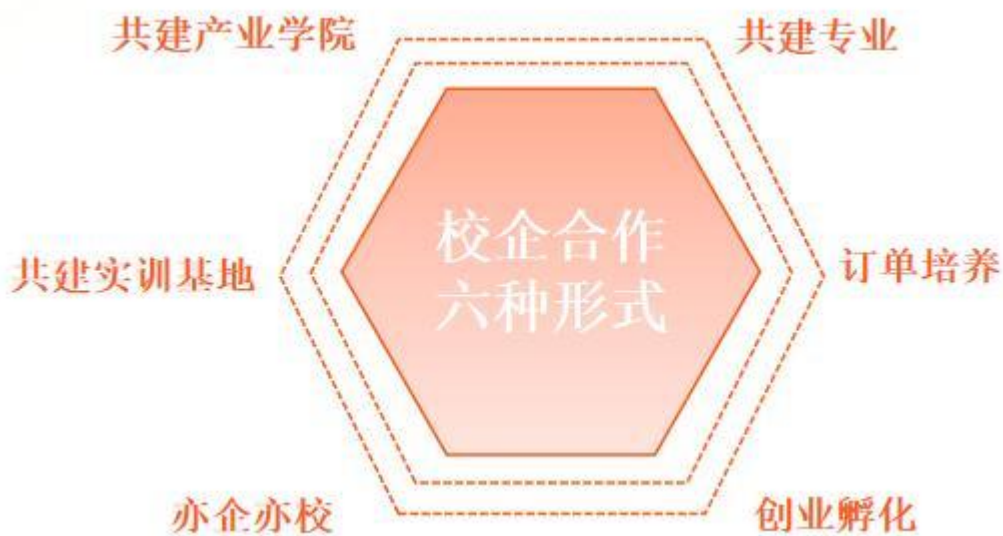
图 1 南阳市科创中等职业学校校企合作形式