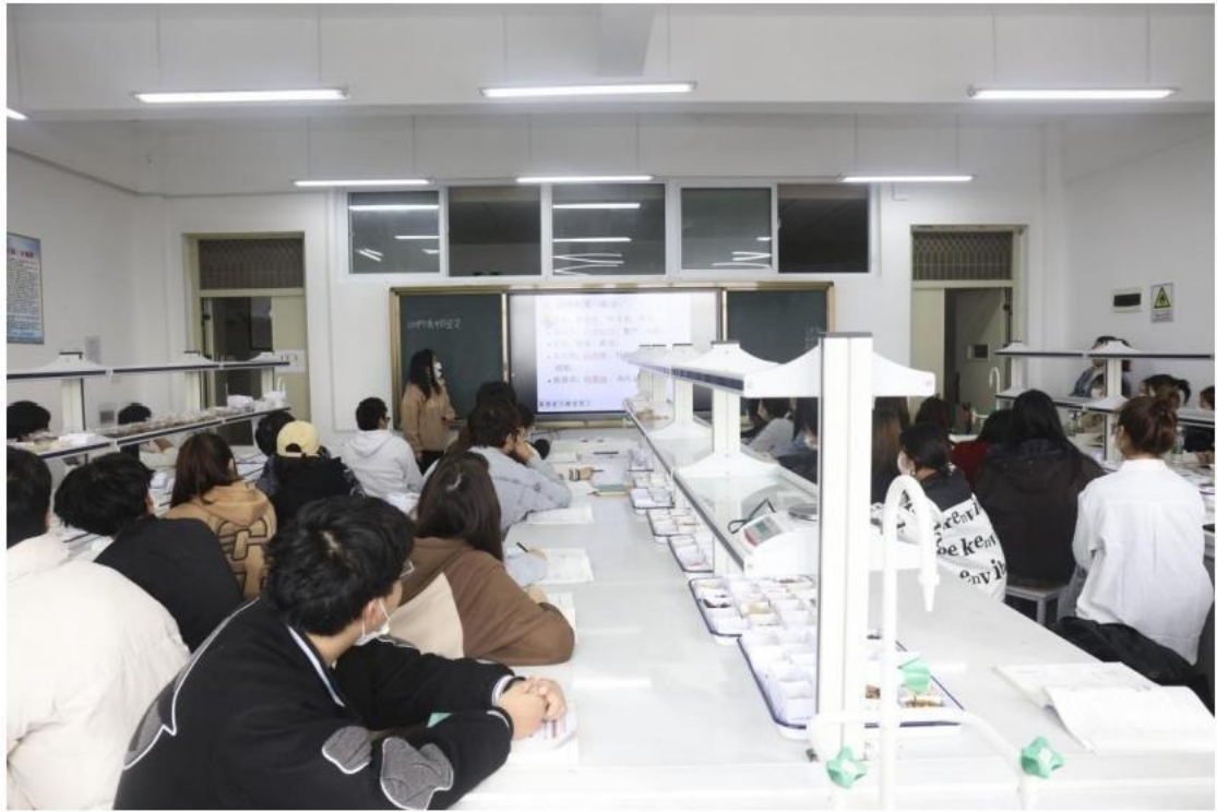
企业进行专业培训