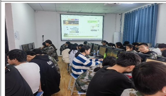
电子商务专业培训