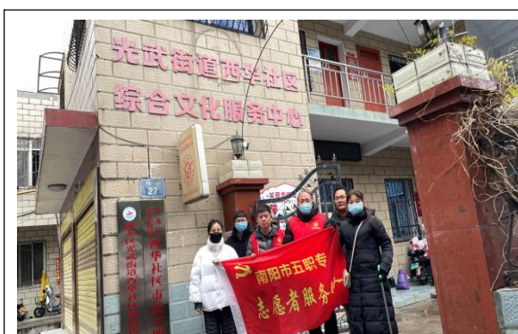
西华社会志愿服务队

精神，把志愿者服务意识和回报社会理念深入居民，学校成立志愿者服务领导小组及多志志愿者服务队伍，深入社区开展为老服务、清洁社区、交通引导、疫情防控、健康讲座、礼仪讲座等志愿者服务活动，全所共计参加志愿者服务430余人次。