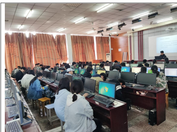
计算机能力提升培训

学校全年共计完成取证 520 人，其中 20 级结毕业生过程性评价取证 493 人（计算机维修工中级 326 人，电子商务师中级 108 人，汽车维修工中级 59 人），22 级计算机专业考试评价取证 27 人（计算机维修工）。