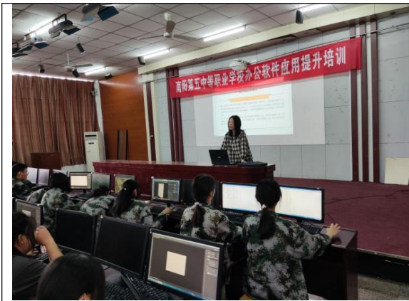
计算机能力提升培训