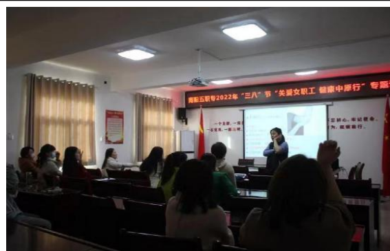
社区妇女健康心理知识讲座