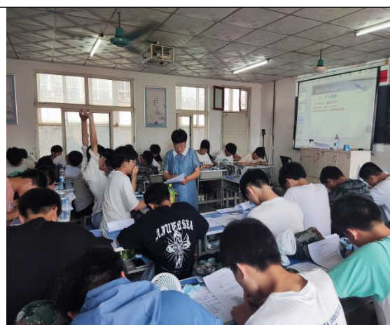
网络创业实施培训