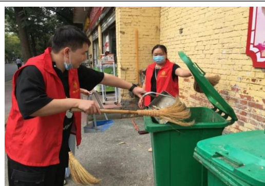
志愿者开展打扫卫生活动