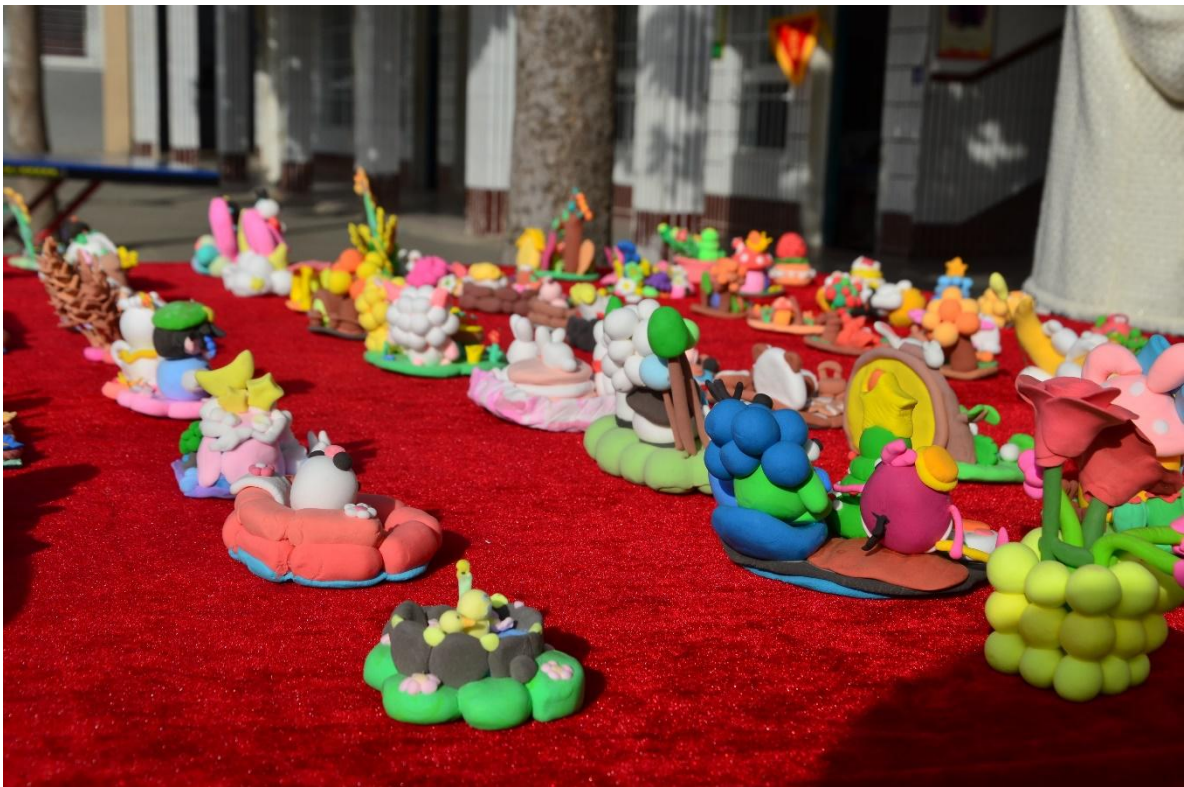
图 9 幼儿保育专业学生作业展