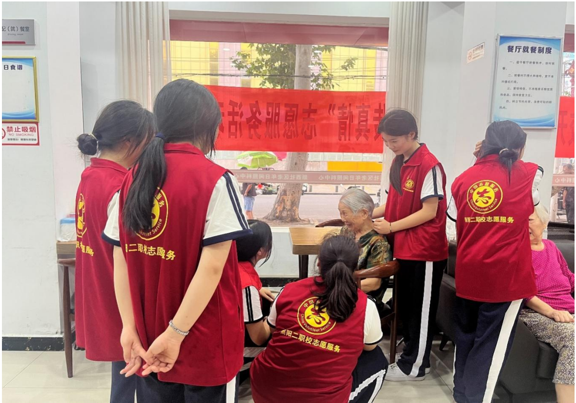
图 21 走进社区 关爱老人