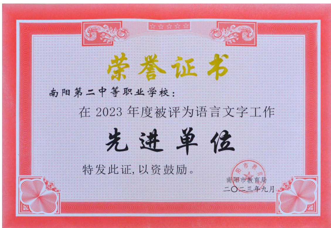
图 4 学校被南阳市教育局评为“语言文字工作先进单位”