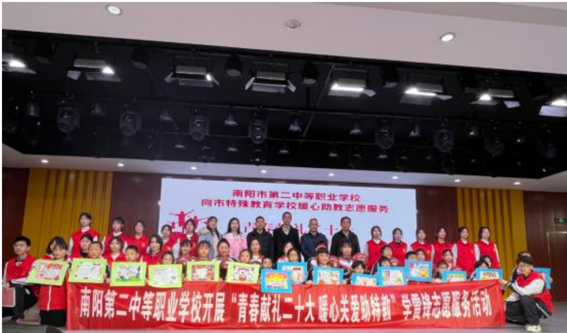
图 27 组织开展“青春献礼二十大 暖心关爱助特教”志愿服务活动（三）