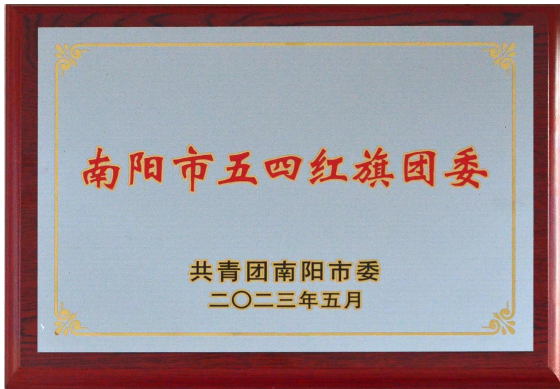
图 3 学校被共青团南阳市委授予“南阳市五四红旗团委”称号