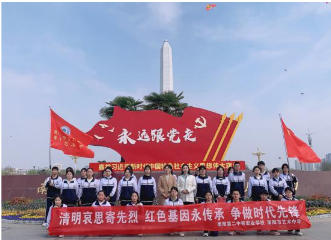
图 34 组织开展“清明哀思寄先烈 红色基因永传承”主题团日活动（一）