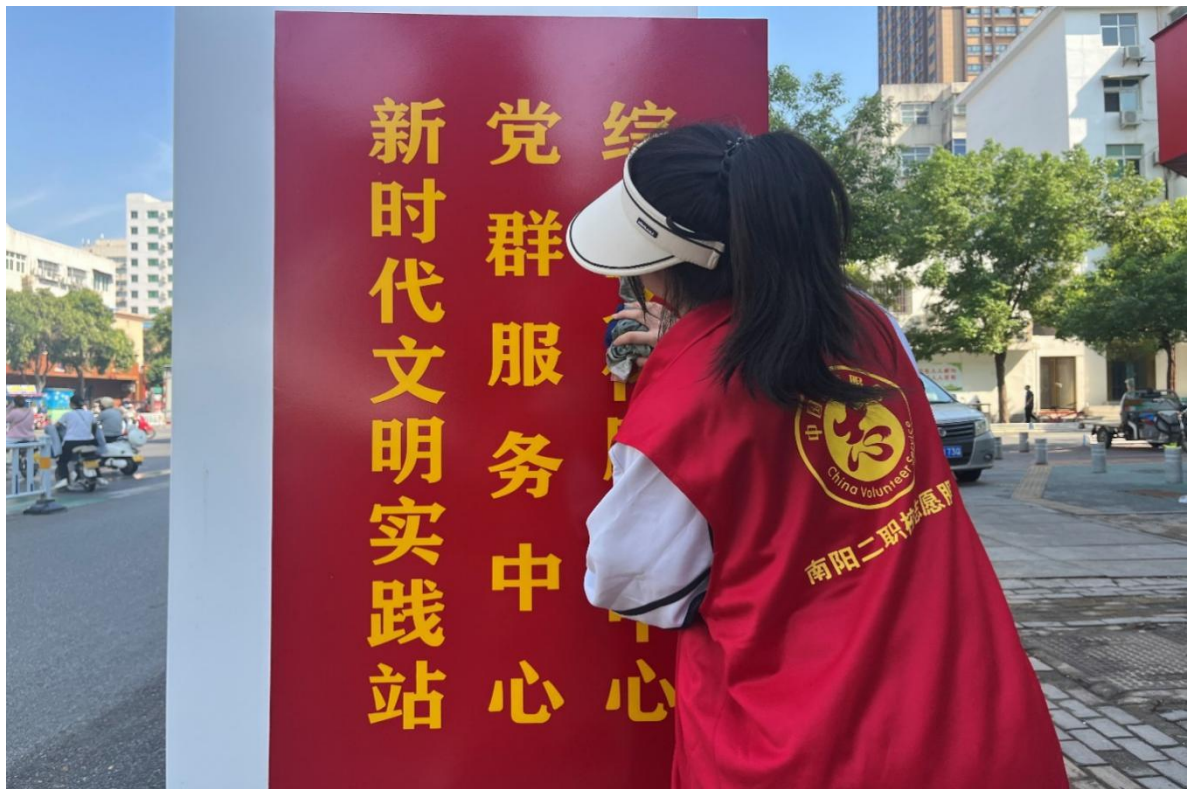
图 20 “追忆红色岁月 传承红色基因”主题团日活动