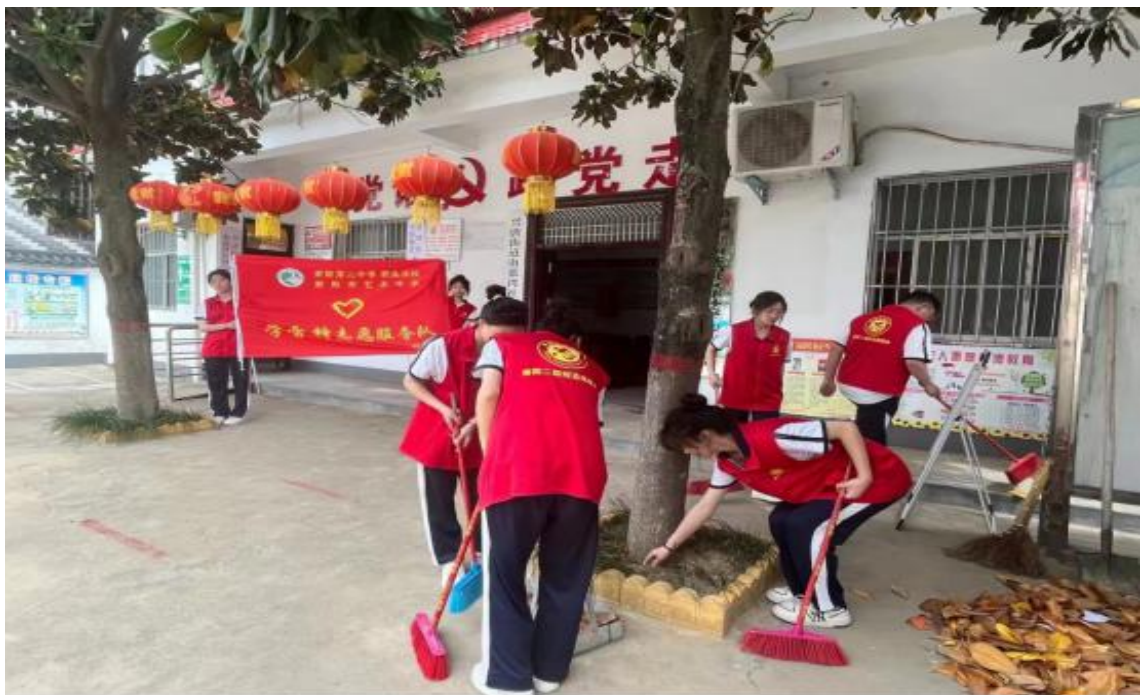
图 22 学雷锋志愿服务队走进唐河县兴唐南张湾社区志愿服务活动