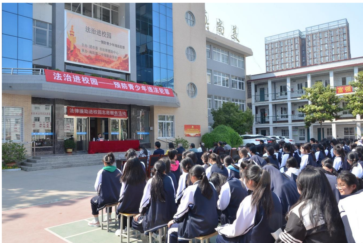
图 44 召开“法治进校园——预防青少年违法犯罪”法治报告会

位认同度和荣誉感。加强学风建设，提升学生文明素养，提高学生组合素质。统筹宿舍管理和文明素养培养行动，着眼于学生日常生活习惯、内务整理、卫生健康等良好健康习惯培养，统筹文明修身行动，着力培养做好良好生活习惯养成教育。强化阳光心理塑造，开展心理教育宣传行动，提前进行学生心理危机干预，提升学生心理健康水平。做好学生安全教育，引导学生提高安全防范意识和消防安全意识，教会学生安全危机应对措施和方法。积极联系公安，消防，社区组织反恐演练及讲座、消防演练及培训、反诈骗宣讲等活动，提高师生的安全意识；认真排查各项安全隐患，协调科室和部门及时处置；严格要求门卫把好入门关，保证校园安全。