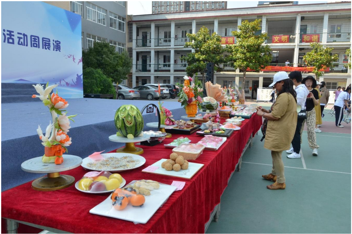
图 37 烹饪作品展