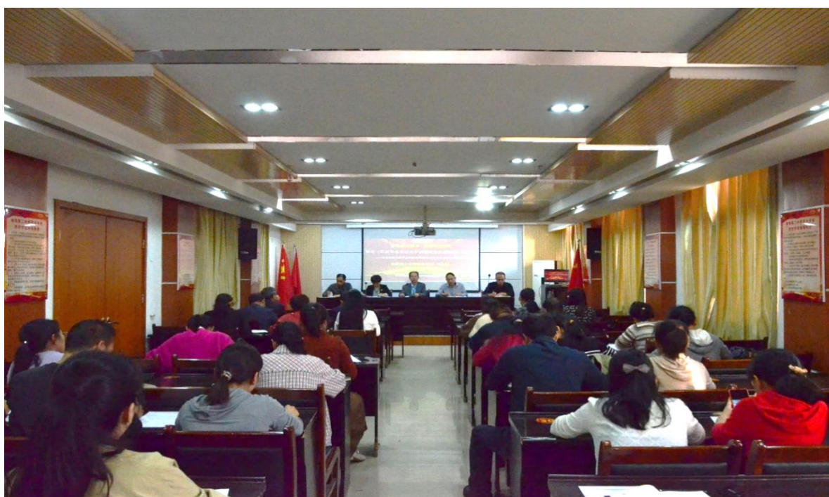
图 43 学校领导讲党课