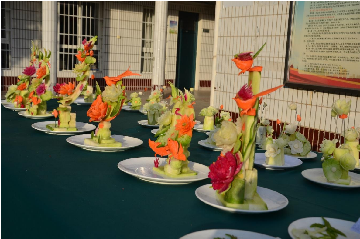
图 10 中餐烹饪专业学生雕刻作业展

加强校本课程数字资源建设，要求每位教师充分利用国家智慧教育平台、省职业教育教学资源库平台等数字课程资源，建设本专业、本课程的数字课堂教学资源，每学期制作 1-3 节精品数字课堂教学资源。组织教师参加国家、省、市和校本各类智能化教学培训，不断更新提升数字化教学能力，向高效课堂迈出坚实步伐。