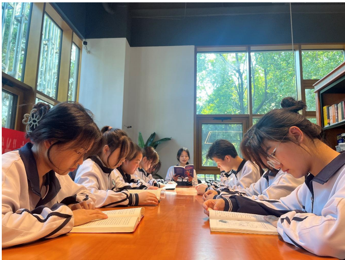
图 36 开展“书香浸润心灵 阅读伴我成长”主题阅读活动

通过多种途径传播传统文化，通过组织开展班会可活动了解中国传统文化；在校园内组织文化活动，如传统文化讲座、文艺展览等，让学生了解和感受传统文化魅力；通过网络平台宣传传统文化，如班级微信群，微信公众号；在日常生活中注重传统礼仪、节庆习俗等方面的传承和弘扬。