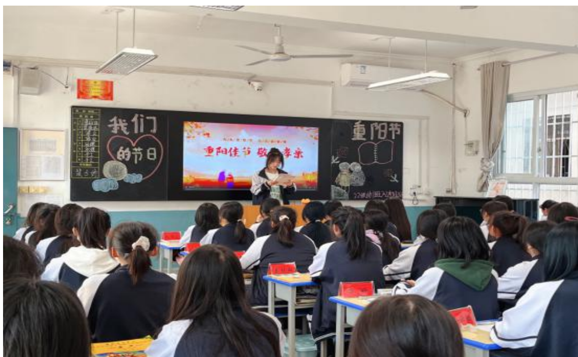
图 28 组织开展“我们的节日—重阳节”主题团班会

文化，厚植爱国主义精神，该校开展“我们的节日”系列主题活动，利用传统节日中秋节、重阳节、春节、元宵节、清明祭英烈、端午节等主题活动，通过各种各样的活动，激发了广大学生对优秀传统文化的热爱，使青年学生在耳濡目染中触摸古人智慧、思维方式，真正热爱，与之共鸣，真正参与到传统文化的继承与发扬中，激励着他们树立远大理想，为实现中华民族的伟大复兴努力奋斗。