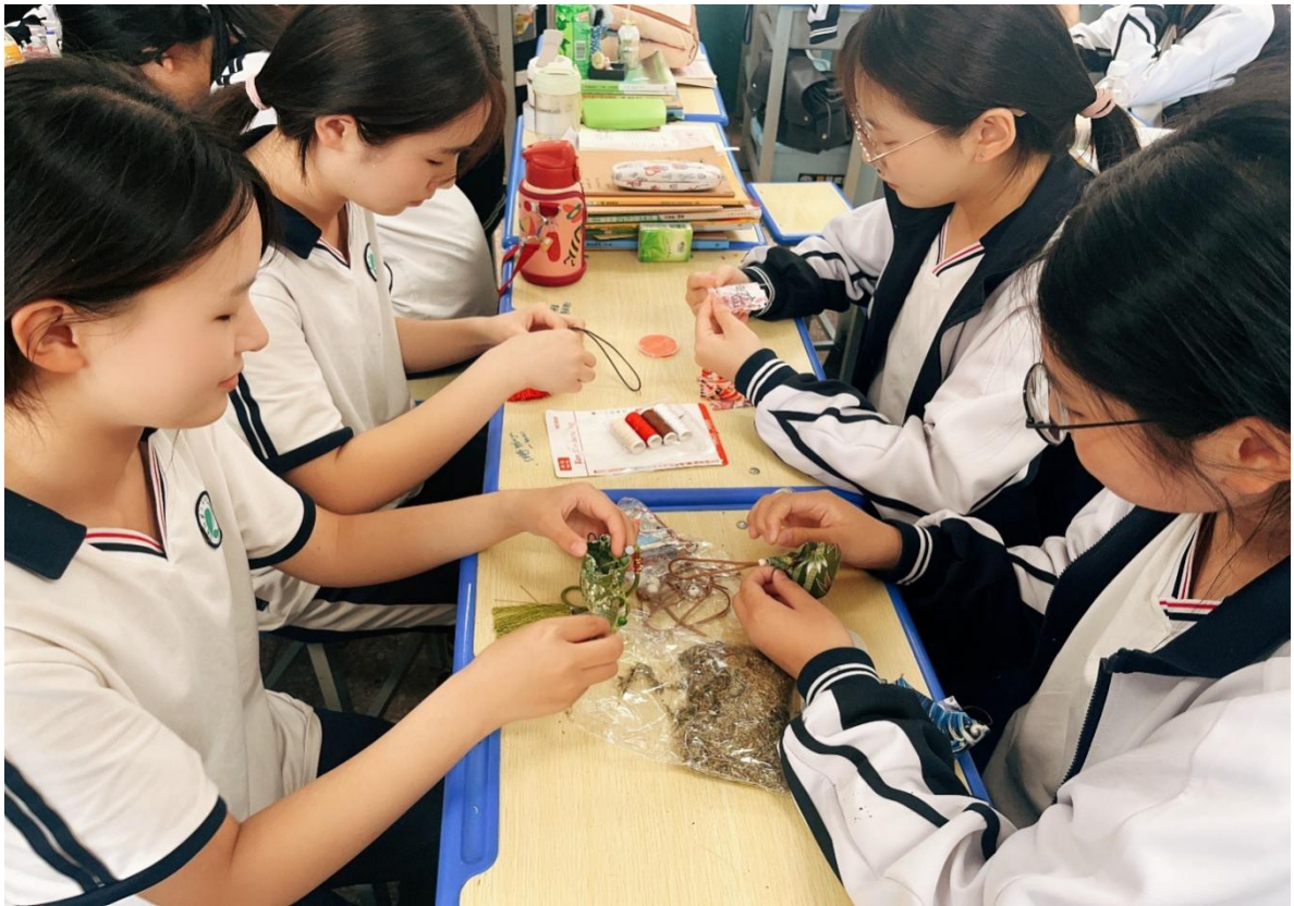
图 32 组织开展“弘扬端午文化 传我浓情粽香”活动（二）