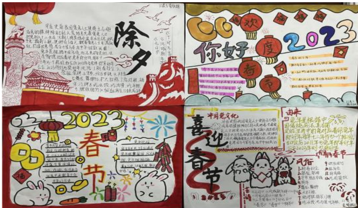
图 30 组织评选“我们的节日—春节”主题优秀手抄报