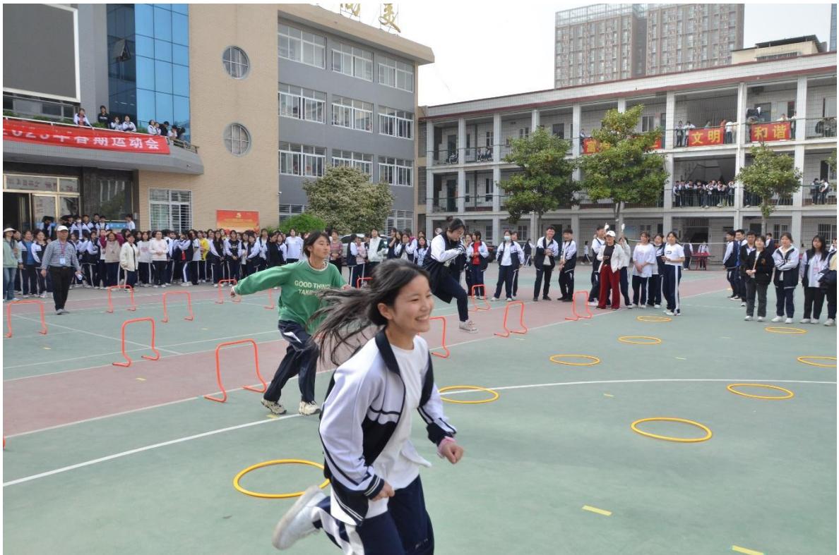
图 40 2023 年春期趣味运动会