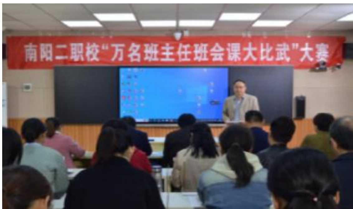
图 7 班主任班会课大比武