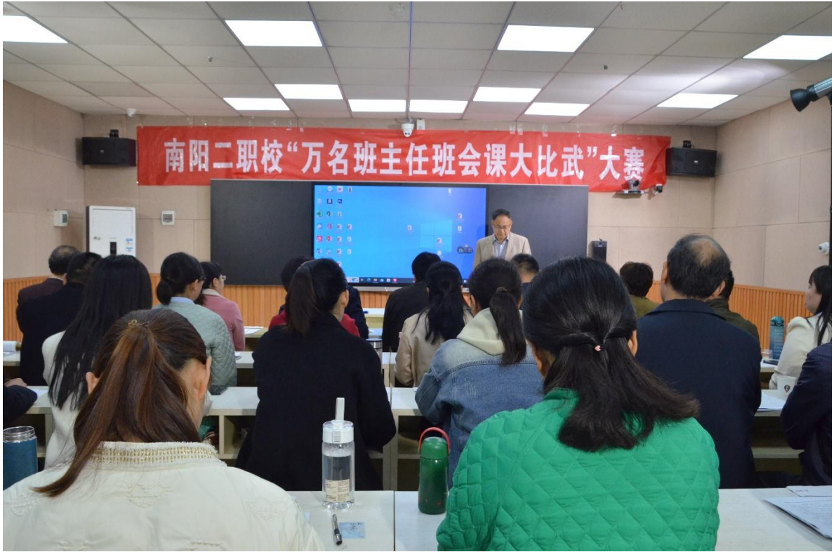
图 47 开展“万名班主任班会课大比武”大赛