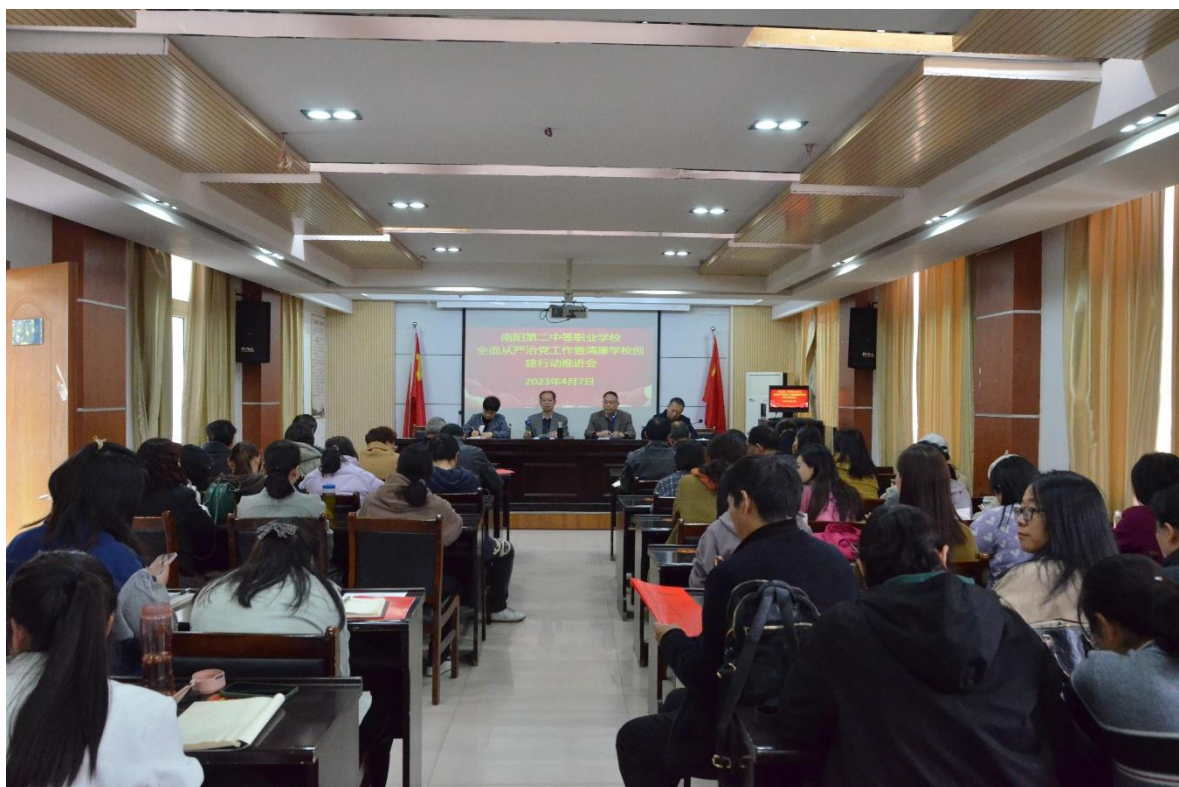
图 42 召开全面从严治党及清廉学校创建工作推进会