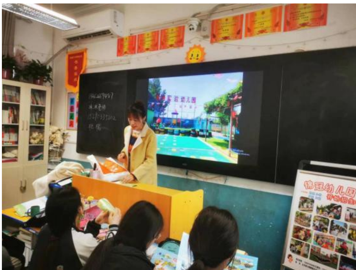
图 12 幼儿保育专业合作幼儿园到校宣讲（一）

学校制定学生实习计划，多方联系企业，对学生进行实习政策宣讲，把企业请进来搞交流推介会，企业进班宣讲 20 余场次，有力地推动了学生顶岗实习工作，加强了与企业的联系，还积极地宣传了学校，取得了很好的社会效益。21 级学生本校顶岗实习单位 58 家，其中与专业相关的企业 42 家，占总数的 80%。相当一部分学生对推荐的单位总体上比较满意，实习学生情绪稳定，在岗工作安心，企业评价比较高。