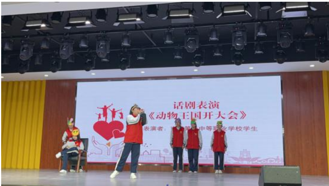
图 26 组织开展“青春献礼二十大 暖心关爱助特教”志愿服务活动（二）