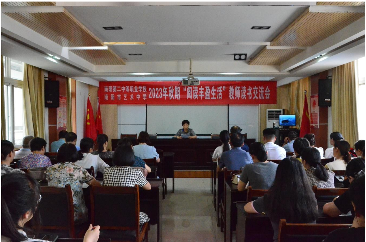
图 48 开展教师读书交流会