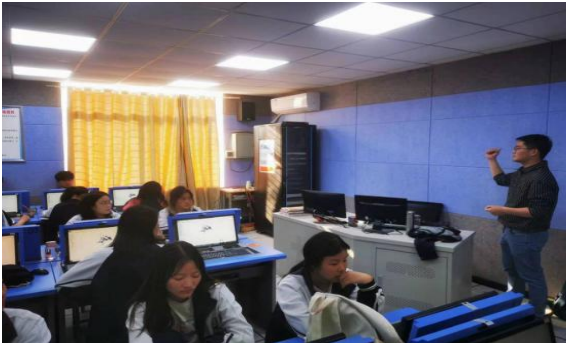
图 16 企业对我校会计事务专业学生进行企业招聘宣讲