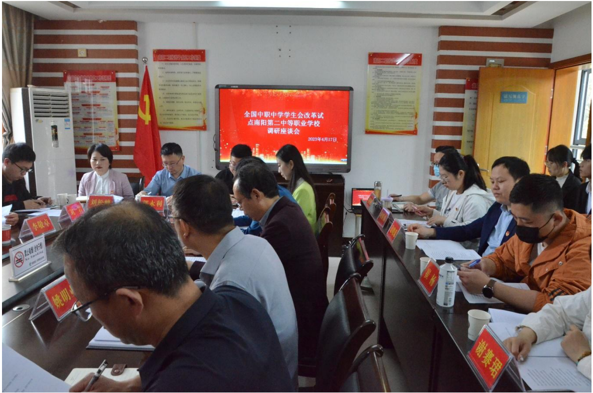
图 45 团市委到学校调研学生会改革工作