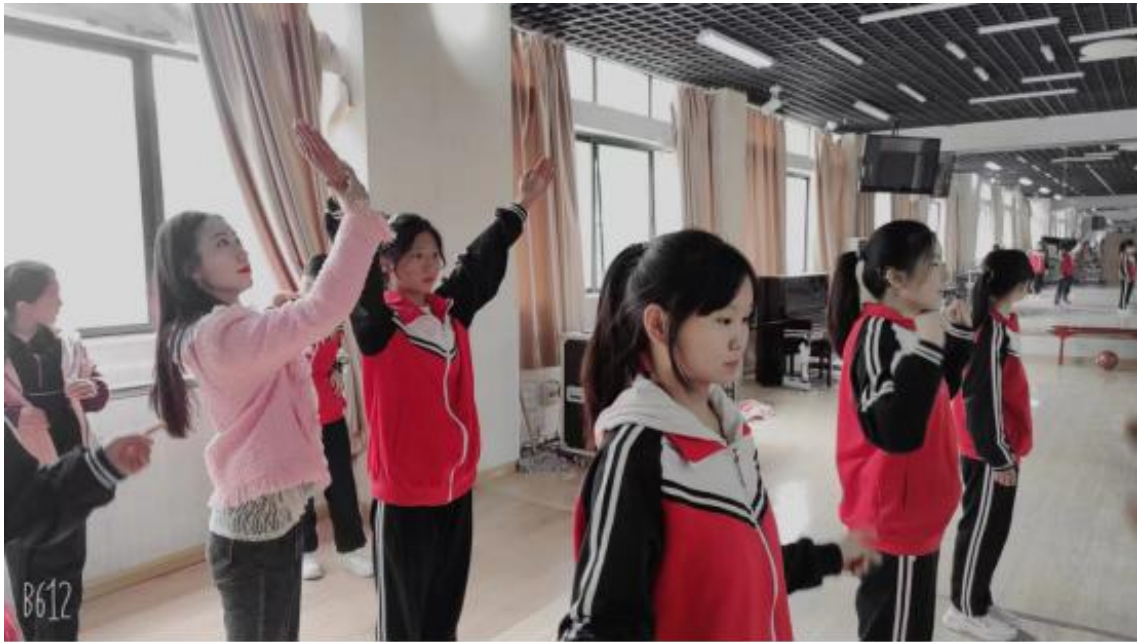
图 25 组织开展“青春献礼二十大 暖心关爱助特教”志愿服务活动（一）