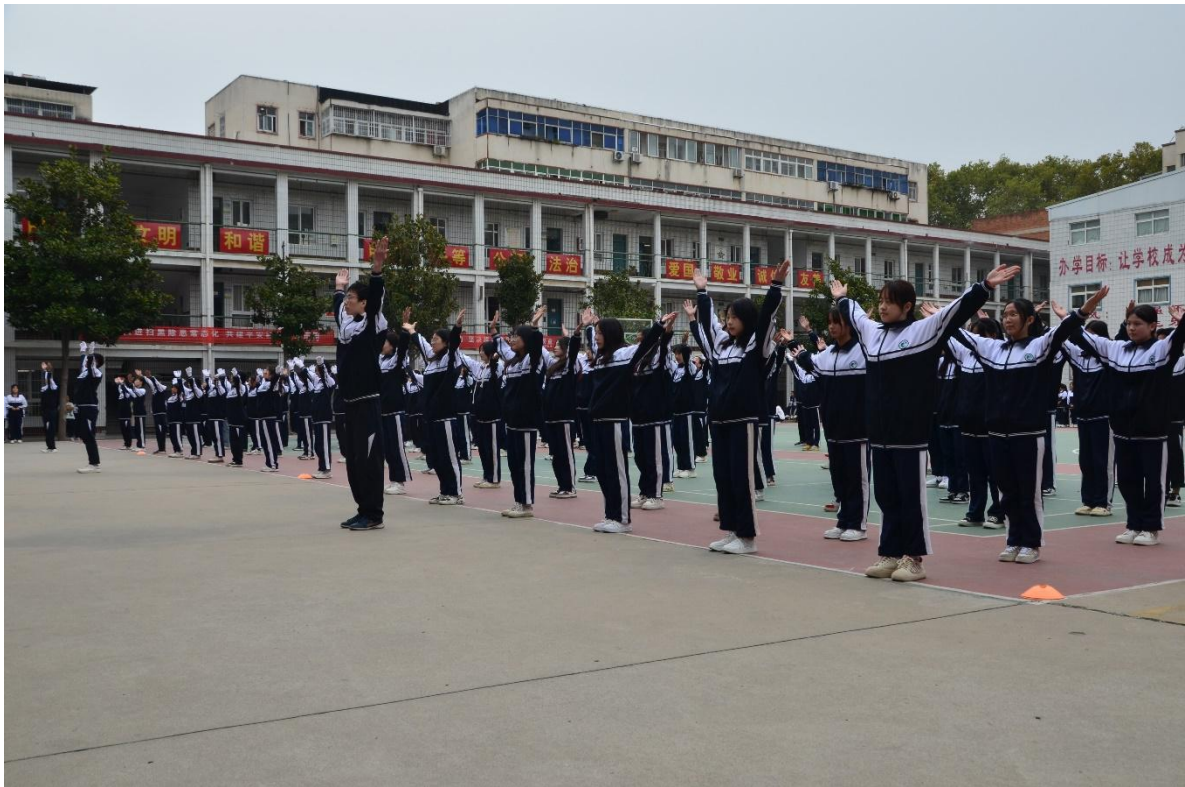
图 41 广播操比赛