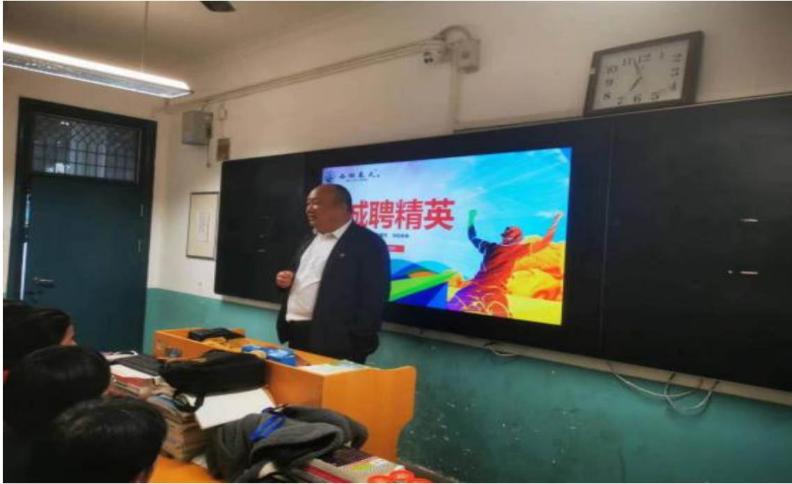
图 15 广东西湖春天餐饮集团对中餐烹饪专业学生进行企业招聘宣讲