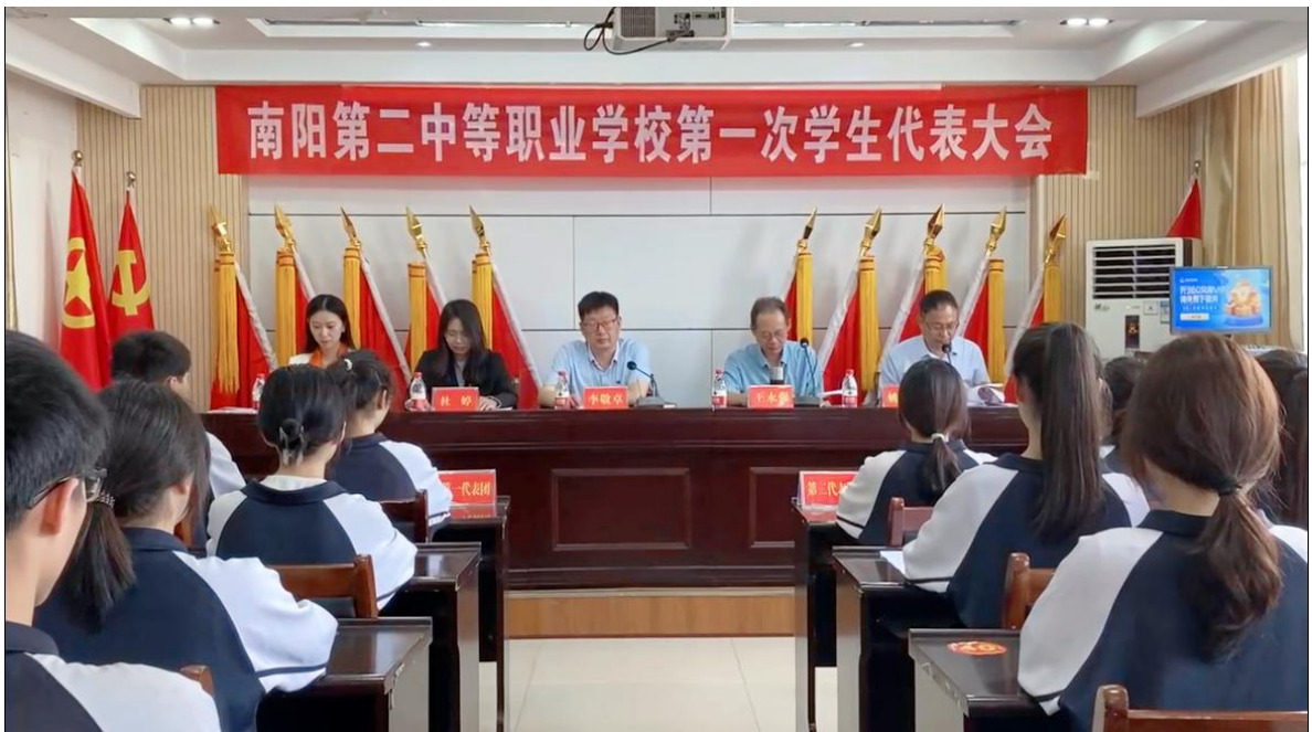
图 46 南阳第二中等职业学校第一次学生代表大会