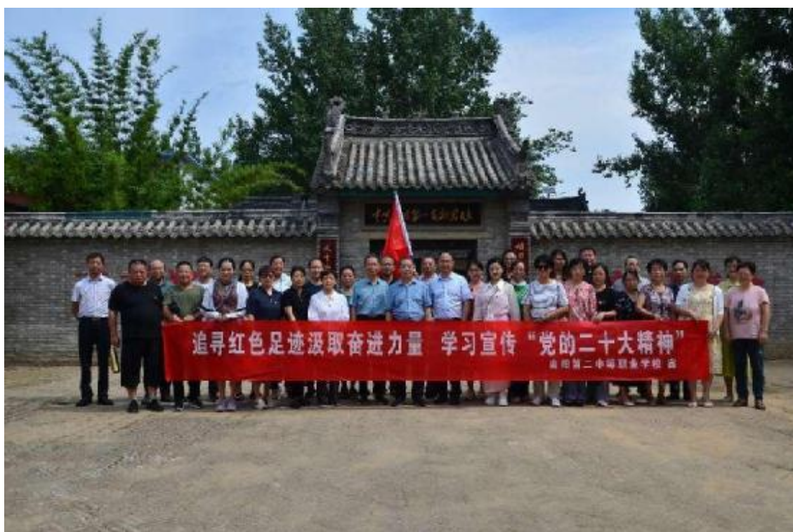
图 33 开展“学思想、强党性”主题党日活动

学校党总支高度重视文化传承，一方面组织、引领、推动学生科、校团委、教务科等相关科室开展好中华优秀传统文化的传承；另一方面积极加强党建文化，坚持党史学习教育常态化，弘扬红色精神。如今年是中国共产党成立 102 周年，借此契机，为深入学习贯彻习近平新时代中国特色社会主义思想，传承红色基因，追寻红色足迹，7 月 1 日，学校全体党员赴中共南阳市第一支部旧址开展“学思想、强党性”主题党日活动。