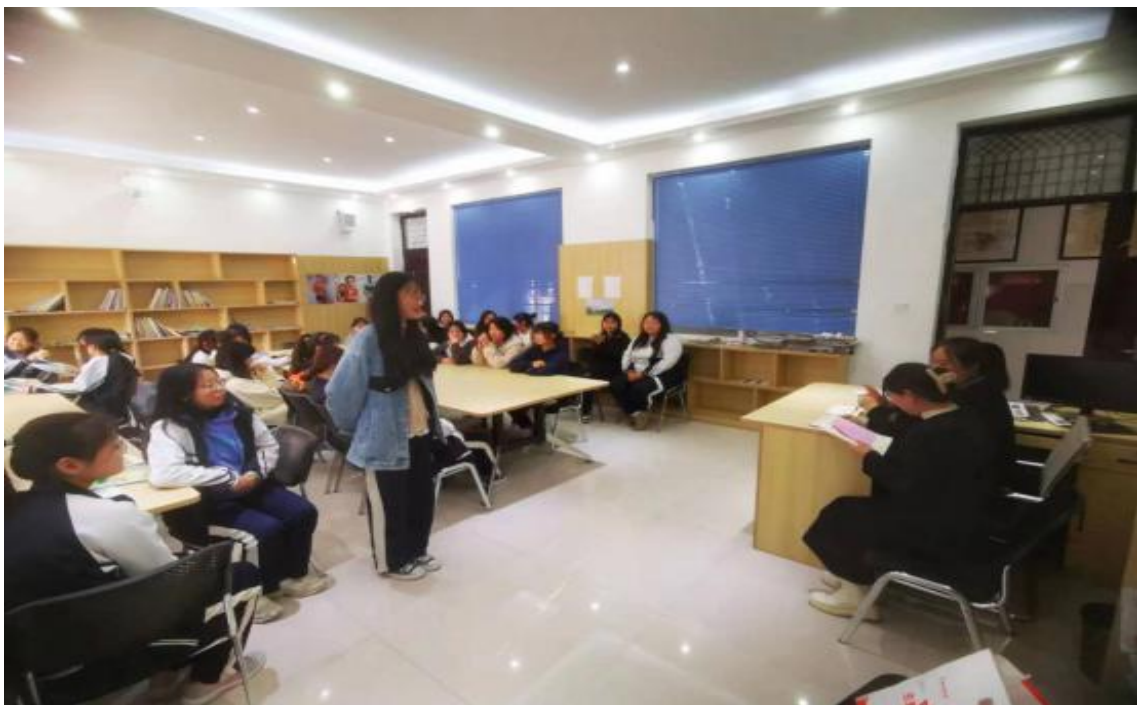
图 14 企业对幼儿保育专业实习报名学生进行面试