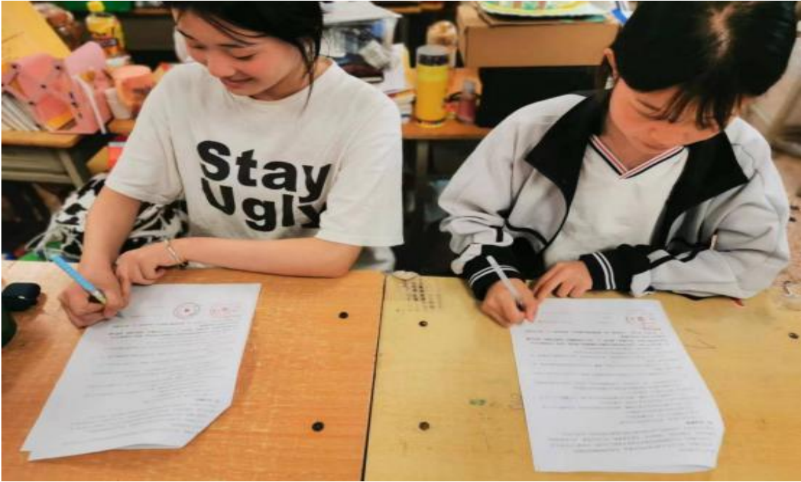
图 17 学生认真签订顶岗实习三方协议书