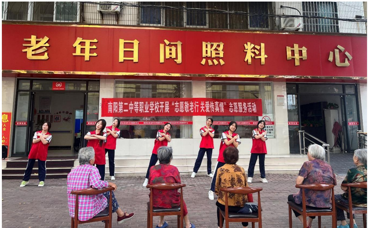
图 19 开展“志愿敬老行 关爱传真情”志愿服务活动