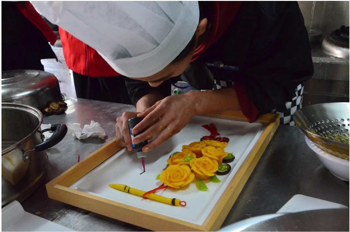
图 8 学生参加技能比赛