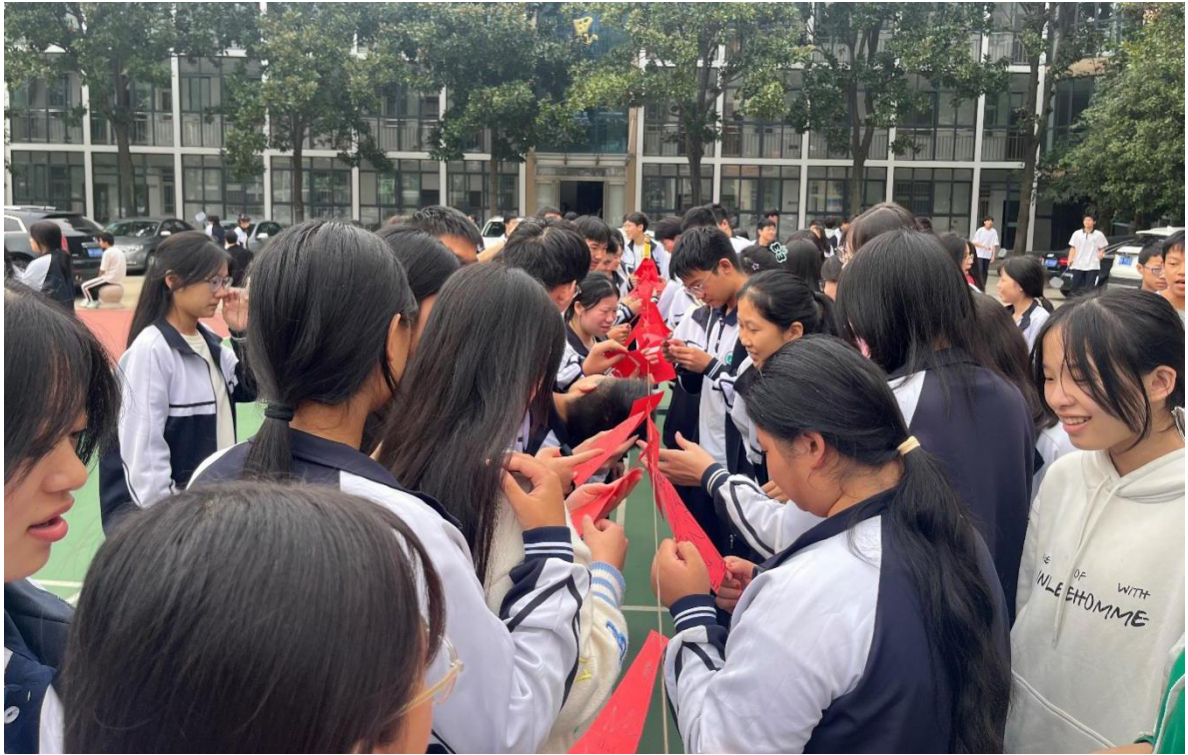
图 29 开展“中秋佳节猜灯谜 师生同乐庆团圆”活动