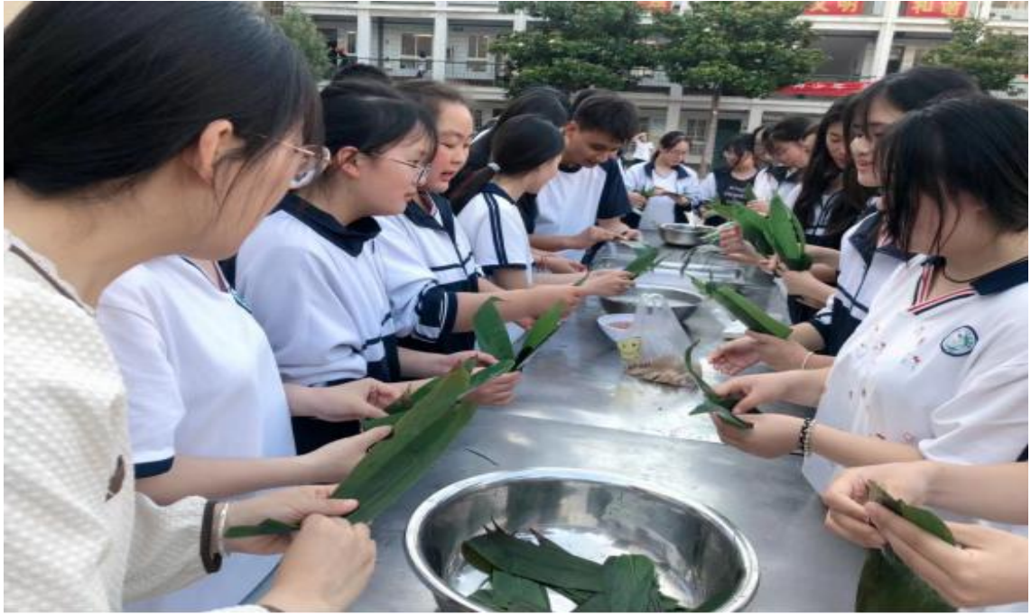
图 31 组织开展“弘扬端午文化 传我浓情粽香”活动（一）