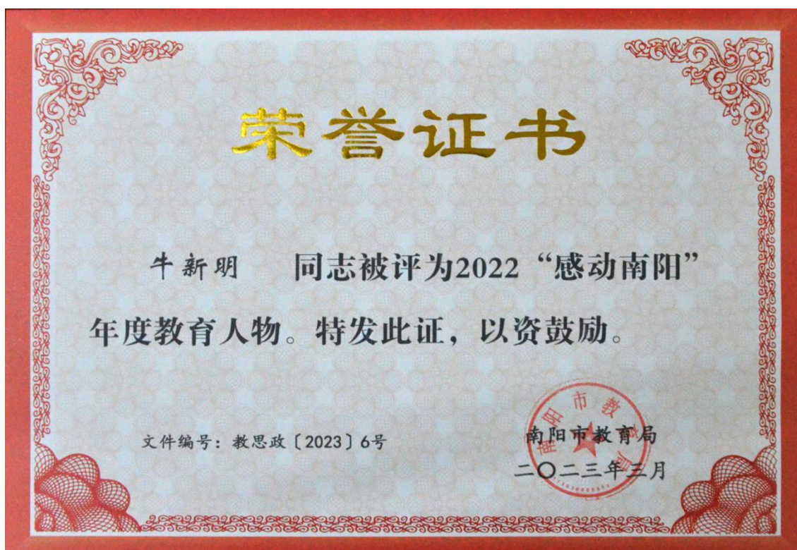
图 5 牛新明同学被评为 2022“感动南阳”年度教育人物