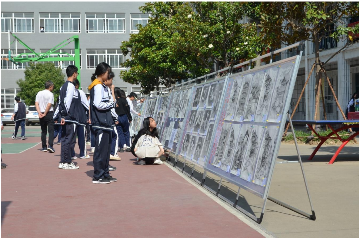
图 38 工艺美术专业作品展