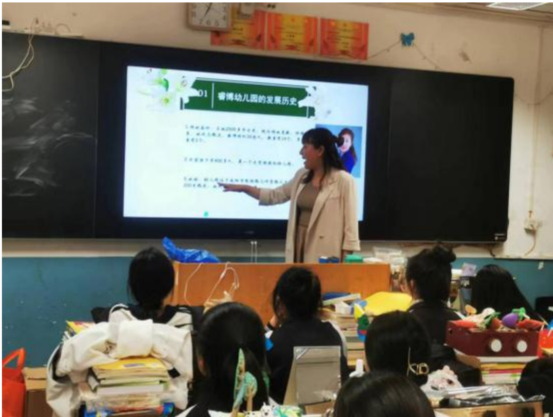
图 13 幼儿保育专业合作幼儿园到校宣讲（二）