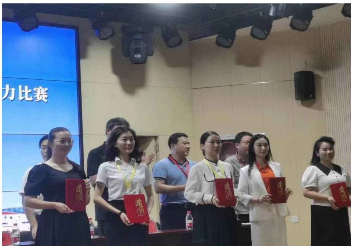
图 6 教师参加班主任能力大赛