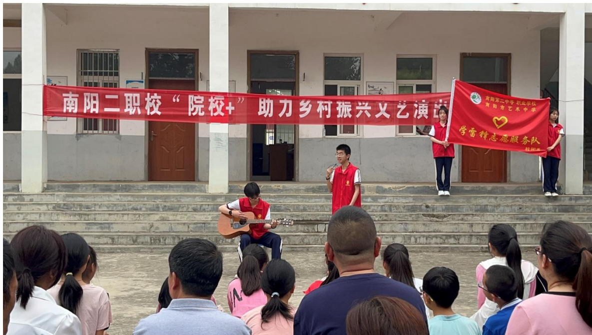
图 18 南阳二职校“院校+”助力乡村振兴文艺演出