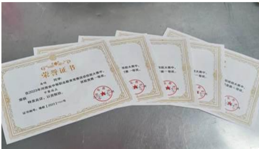
图 11 技能竞赛部分获奖证书

个三等奖，在第五届中华经典诵写讲大赛“诵读中国”经典诵读大赛，学校获得 1 个国家级三等奖。