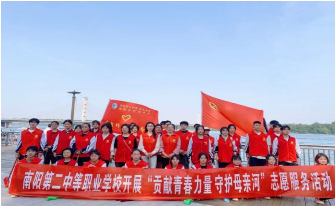
图 23 组织开展“贡献青春力量 守护母亲河”志愿服务活动（一）