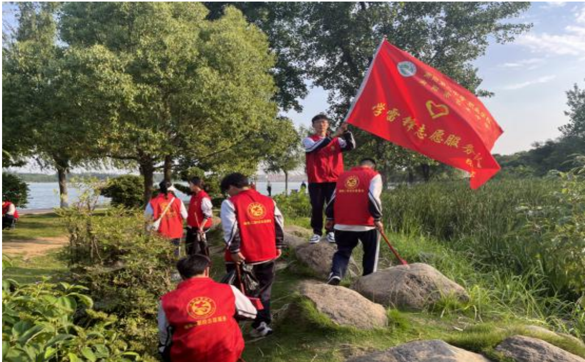
图 24 组织开展“贡献青春力量 守护母亲河”志愿服务活动（二）