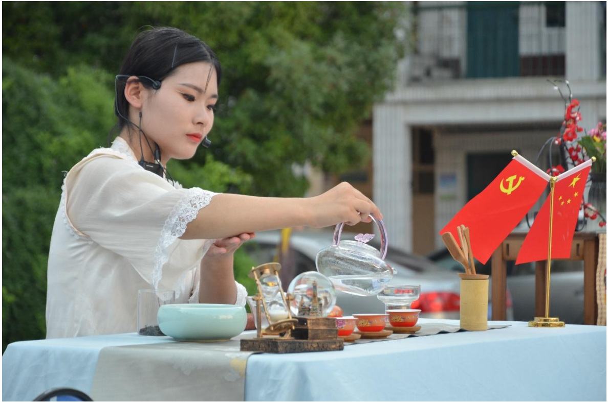
图 39 茶艺展示