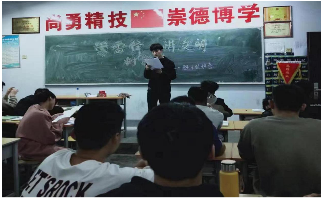
“学雷锋 讲文明”主题班会照片