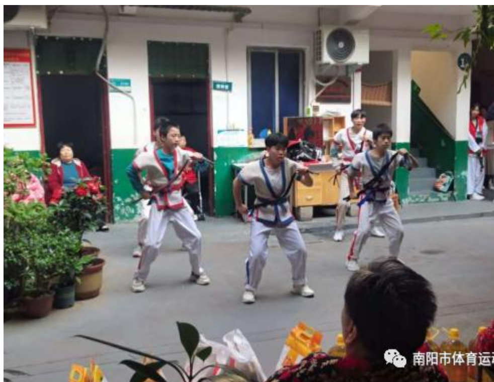
(柔道队基本功表演)