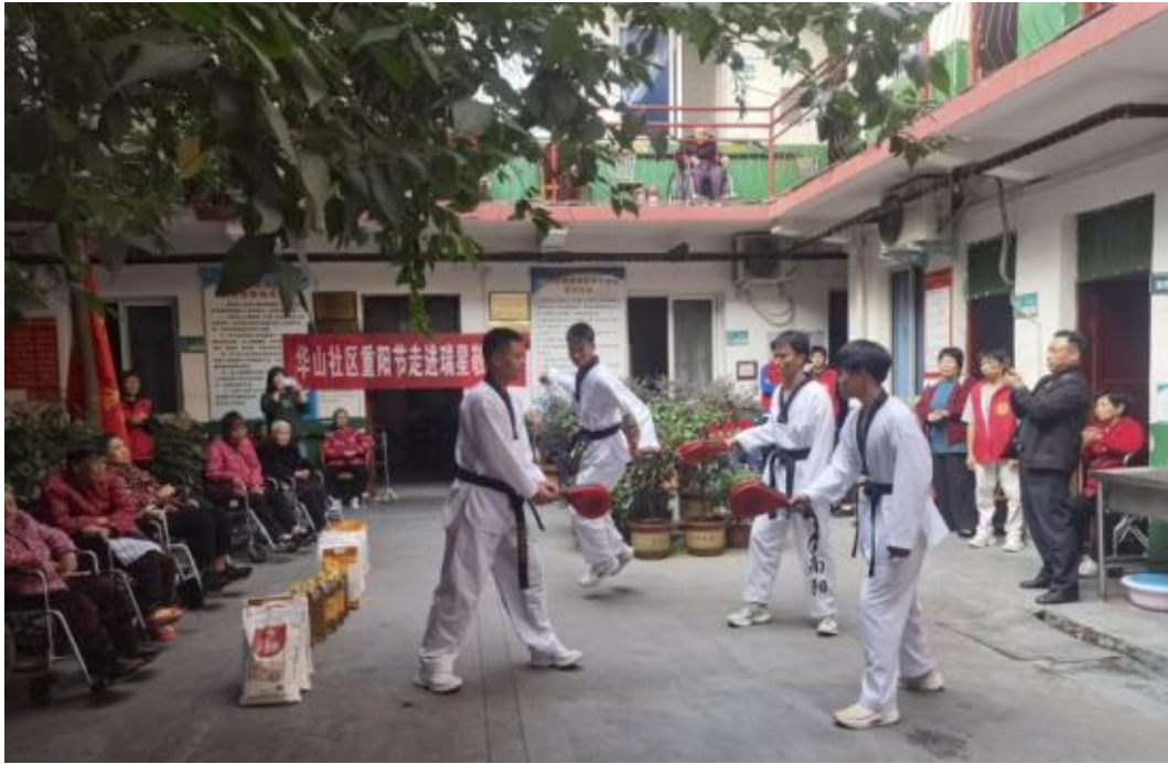
(跆拳道队技艺表演)

本次活动不仅让老人们感受到了社区、学校的关爱和温暖，更在学生们心中播撒下尊老、爱老、敬老、助老的种子，引导学生积极参与到爱老、敬老的活动中来。