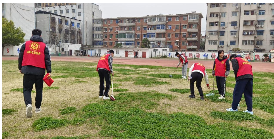
校团委组织优秀团员代表打扫操场卫生