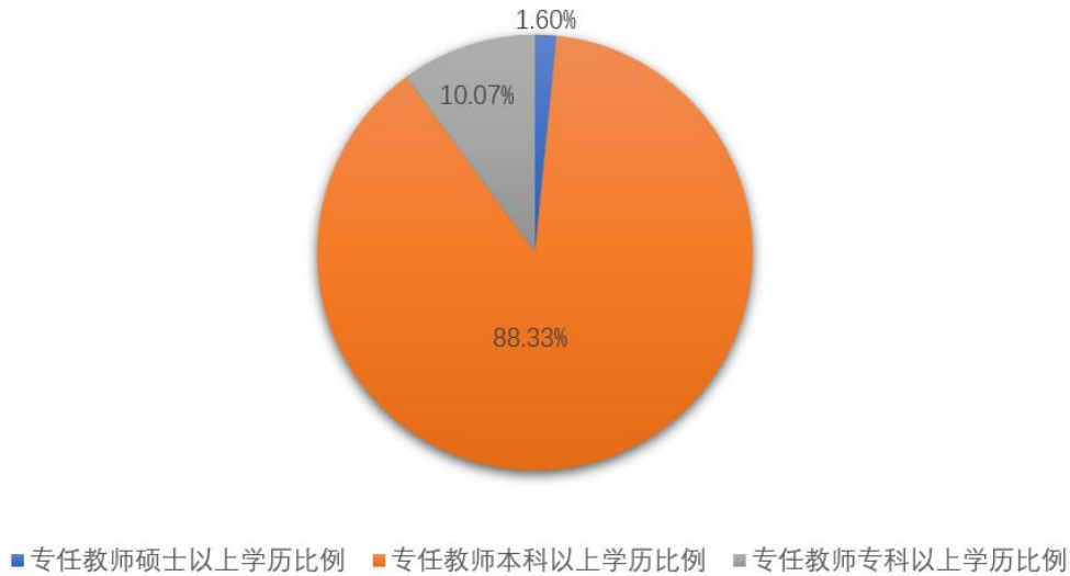
图 8. 体校教师学历对比图

重视教师发展和优化队伍结构，师资队伍建设成效显著。为优化师资队伍学历、职称和“双师”结构，我校大力加强师资培养工作。我校专任教师分为教师和教练，40 岁以下青年教师、教练 7 人，占 11.4%，学校将进一步招聘青年高层次教育人才。通过教育教学的专项强化训练，并经过严格考核，学校师资队伍已成为一支思想作风过硬，技能水平精湛，综合素质高的师资队伍。师资力量是教学质量的根本保证，为南阳体校的可持续发展充分发挥着基础性、稳定性作用。