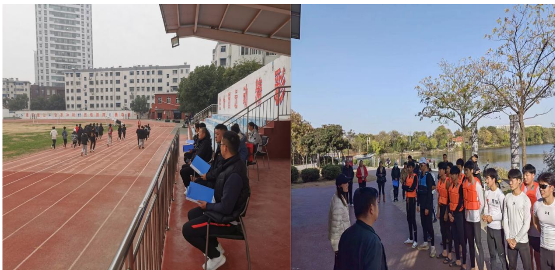
图 7. 教练员在进行训练听评课

三是建立和谐师生关系，关心“困难学生”群体，以文明教风带动学风建设。积极倡导并建立“在人格上尊重学生，感情上关心学生，工作中信任学生”的和谐师生关系。在教师中提倡使用文明用语，提倡养成文明习惯，提倡课余时间多与学生交流，提倡因材施教。