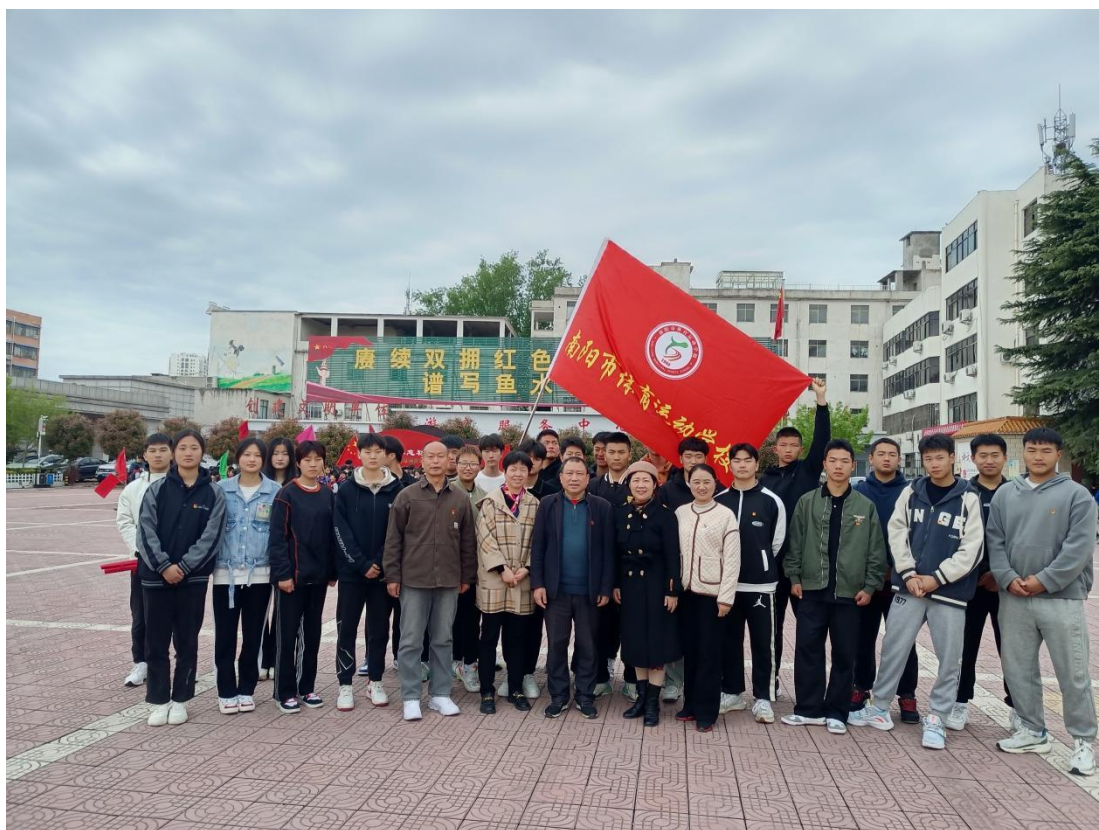
参加活动党员和学生代表合影

2023年4月4日上午,根据南阳市卫健体委的通知要求,我校组织广大党员干部及青年团员代表到镇平县彭雪枫纪念馆开展了“我们的节日”清明节主题教育活动。