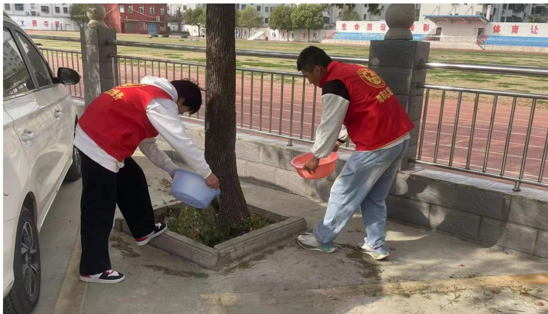
校团委开展“爱绿护绿”植树节活动