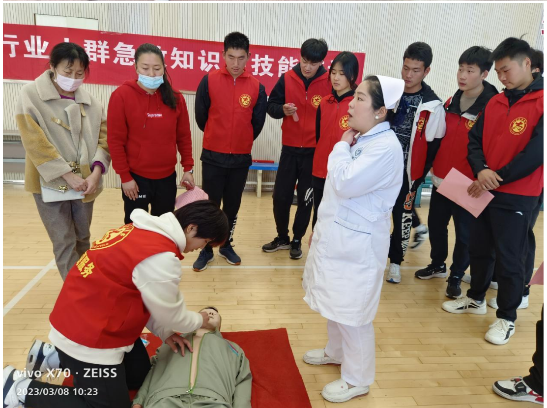
我校志愿者社团参加急救知识培训

通过这些活动，引导广大学生树立正确的世界观、人生观和价值观，自觉做中华民族传统美德的传承者、社会主义