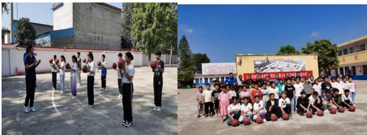
图 5. 南阳市体校助力乡村振兴 案例（3）发挥体校力量，助力乡村振兴

从小养成热爱体育、加强锻炼的习惯，通过体育与乡村振兴的结合提升了帮扶村的文化实力。