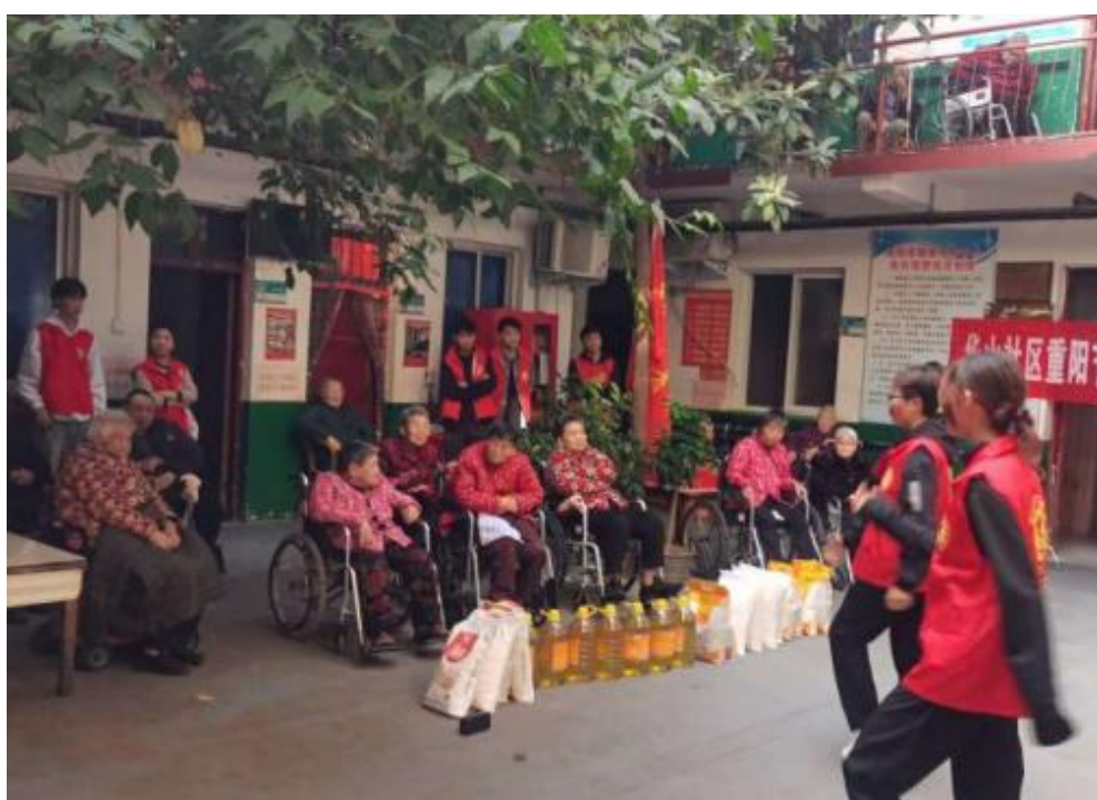
(赛艇队表演手语舞蹈小苹果)