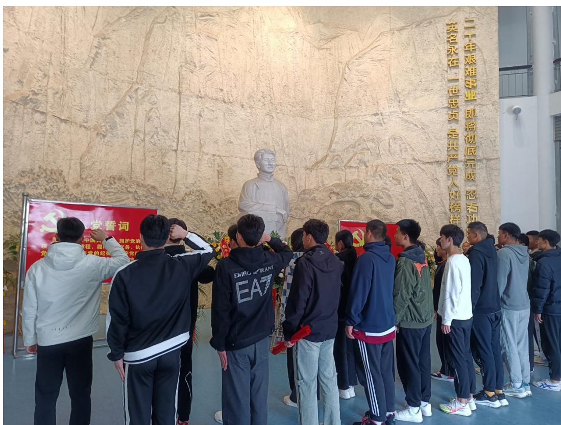
重温入党誓词、入团誓词