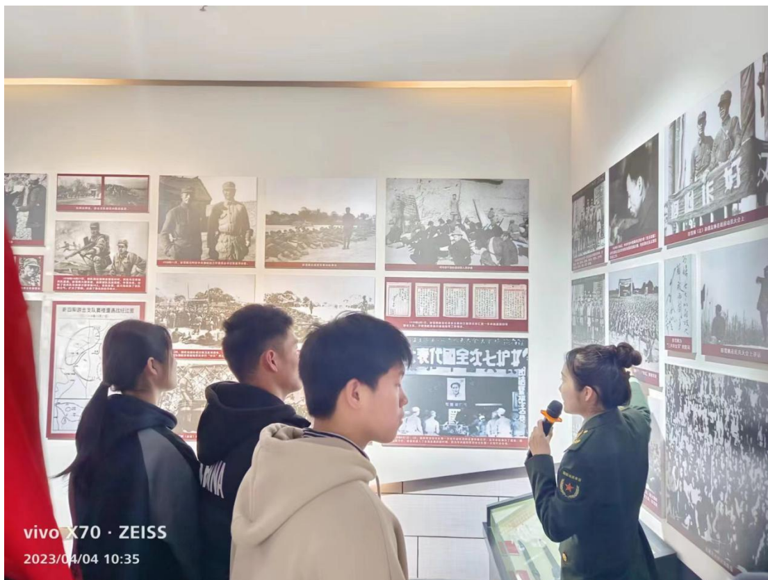
讲解员耐心细致给大家讲解史实