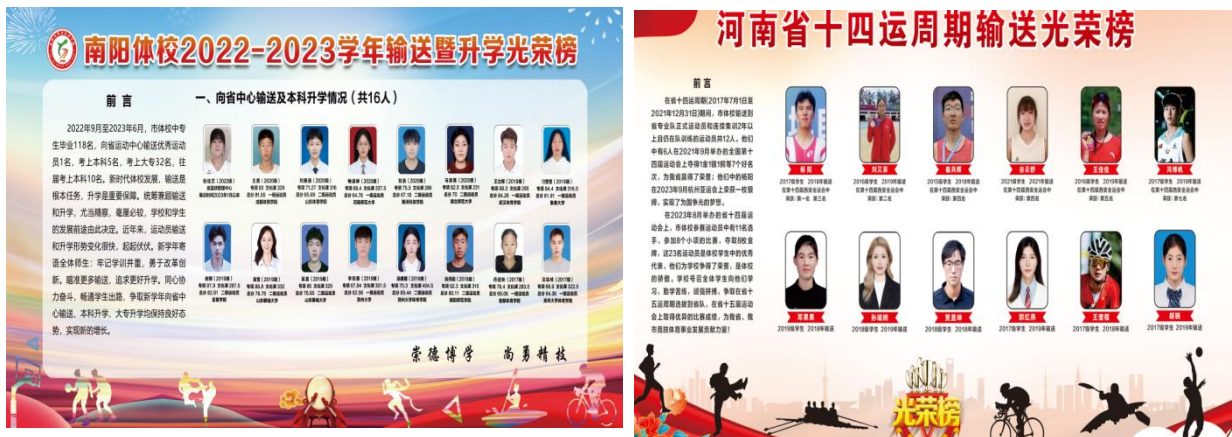
图 2. 2023 年输送、升学光荣榜

畅通学生出路，使学校走上良性发展轨道。2023年11月之前在校学生405人，2022年毕业人数219，2023年毕业生148人。2022年，我校向省运动队输送优秀运动员13名，考上本科4名，专科35名。2023年向省运动队输送及本科输送16名学生。