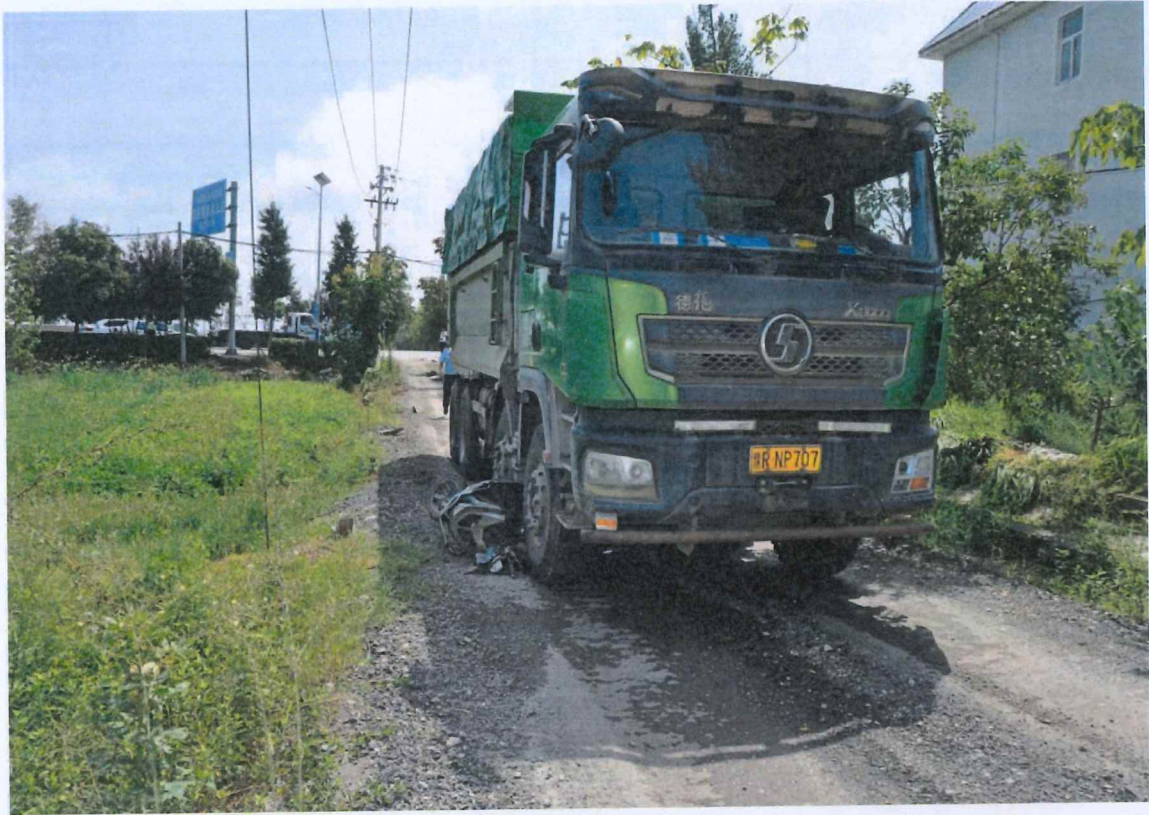
图 6: 两轮电动车位置