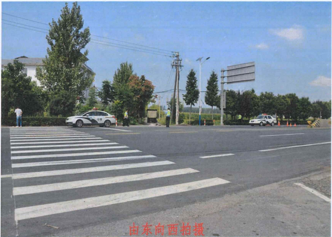
图 4: 事故现场概览