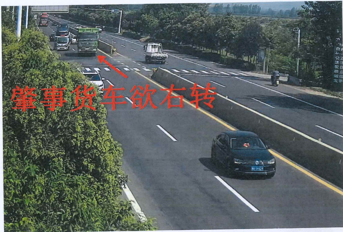
事故发生前事故车辆行驶状况图

4. 事故现场情况：现场勘查时天气晴，中心现场位于 G312 国道西侧支路口内，一成年女性尸体伏卧位，头顶距 G312 国道路西沿 3.8 米，另有一女童尸体伏卧于该中年女性北侧，头颅崩裂，脑组织外溢，肇事豫 RNP707 号陕汽牌重型自卸货车头西尾东停放于支路口西侧 38.4 米，一辆悬挂南阳 1331731（识别号牌）的灰色二轮电动车被挤压于豫 RNP707 号自卸货车右前轮后部。