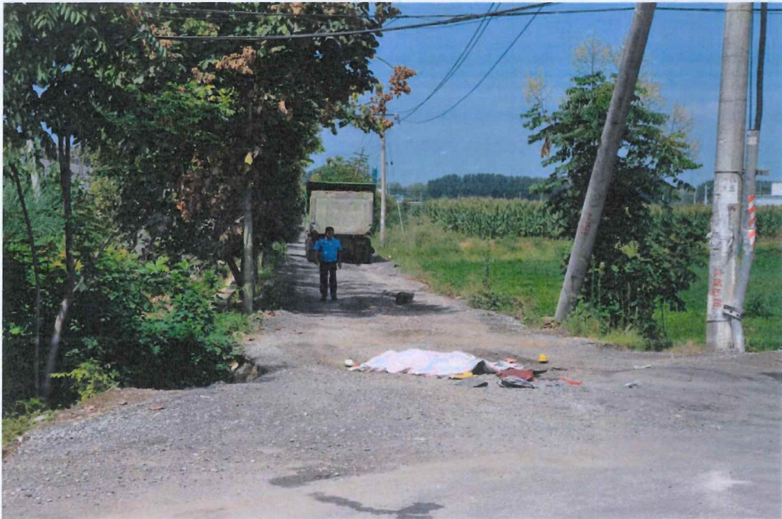
图 5: 事故现场中心