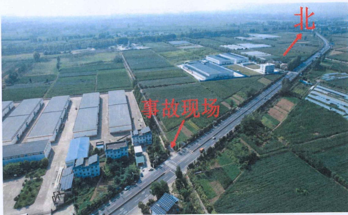
图 2: 现场俯瞰图