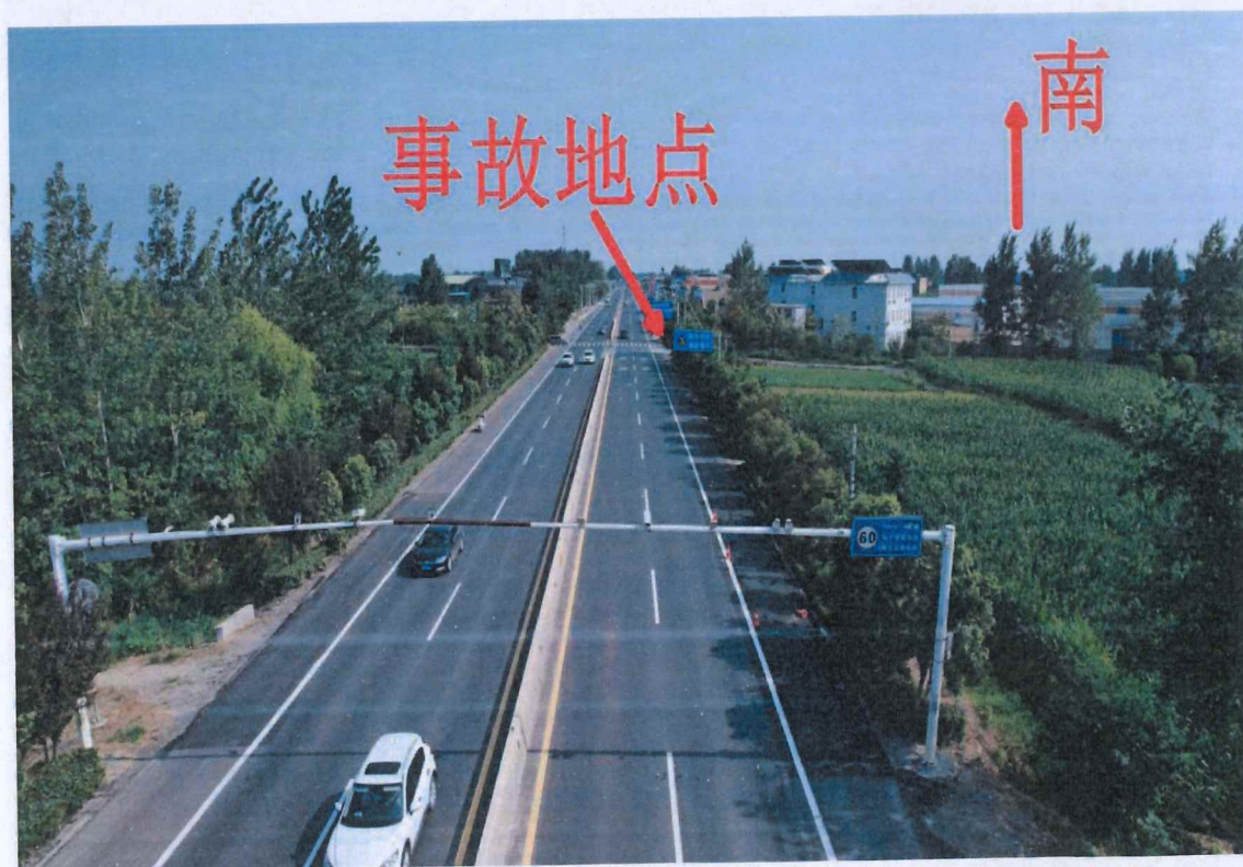
图 3: 现场俯瞰图