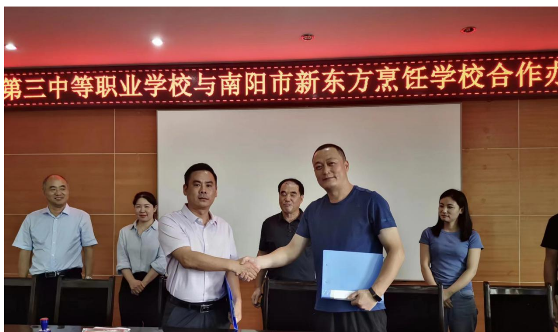
南阳第三中等职业学校与新东方烹饪学校签订合作办学协议

落实习近平总书记关于发展南阳依托月季、艾草等资源优势发展特色产业的重要精神，以卧龙区成教月季繁殖基地作为园艺专业实习实训基地，助力区域特色经济发展。南阳第三中等职业学校有烹饪专业的优质师资，具备扎实的烹饪基本功与娴熟地烹饪技能，并充分利用校内外教育资源，与新东方烹饪学校强强联合，实施“产教结合，全真实训”的人才培养模式。利用校外实践教学基地，培养教师和学生的实践能力，实现优势互补，资源共享，互利共赢。