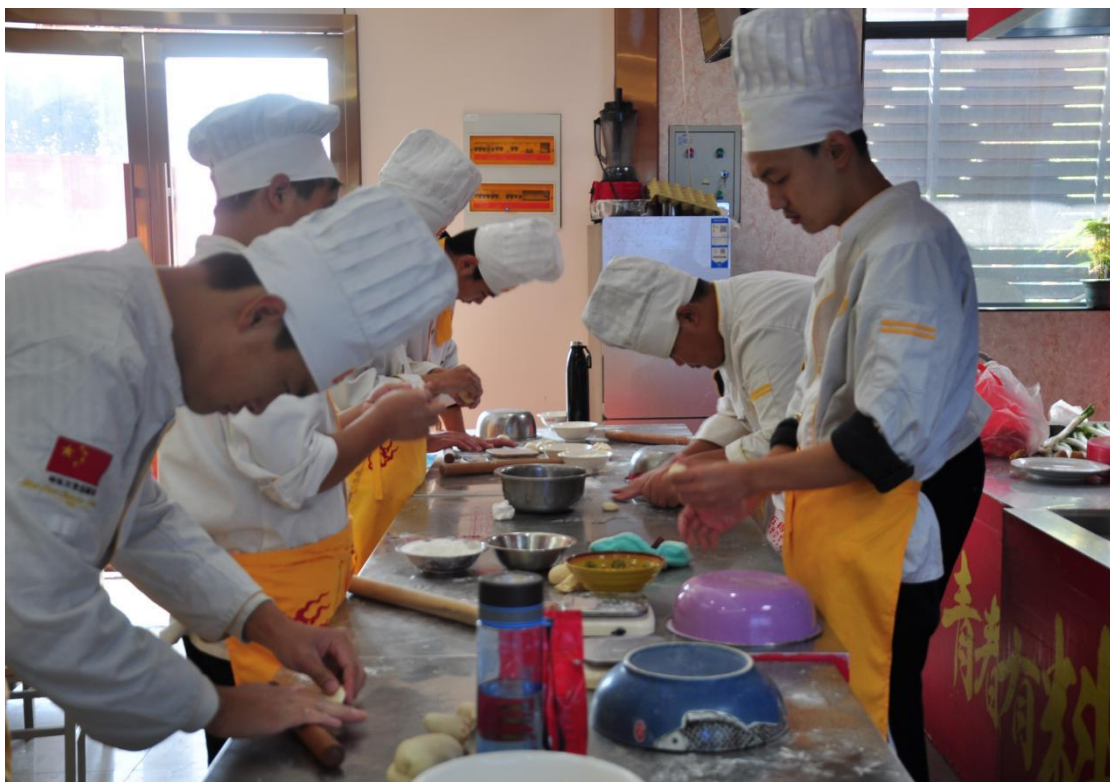
烹饪专业实习实训

实现培养目标与就业岗位需求的对接。紧扣专业培养目标，围绕就业岗位，满足行业岗位对学生知识和能力的需求。根据企业岗位的任务需求，制定培养目标，选择课程项目和内容，这样增强了教与学的针对性，提高了教学效果。