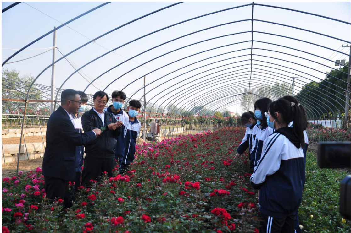
南阳第三中等职业学校园艺专业实习实训基地