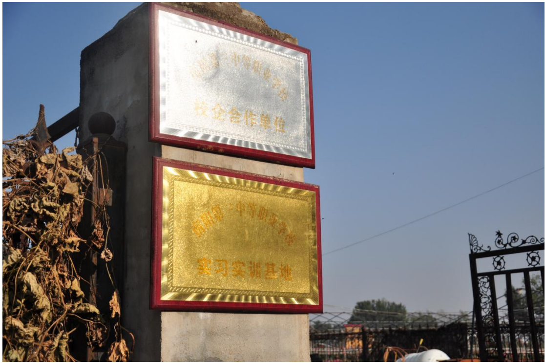
南阳第三中等职业学校园艺专业实习实训基地