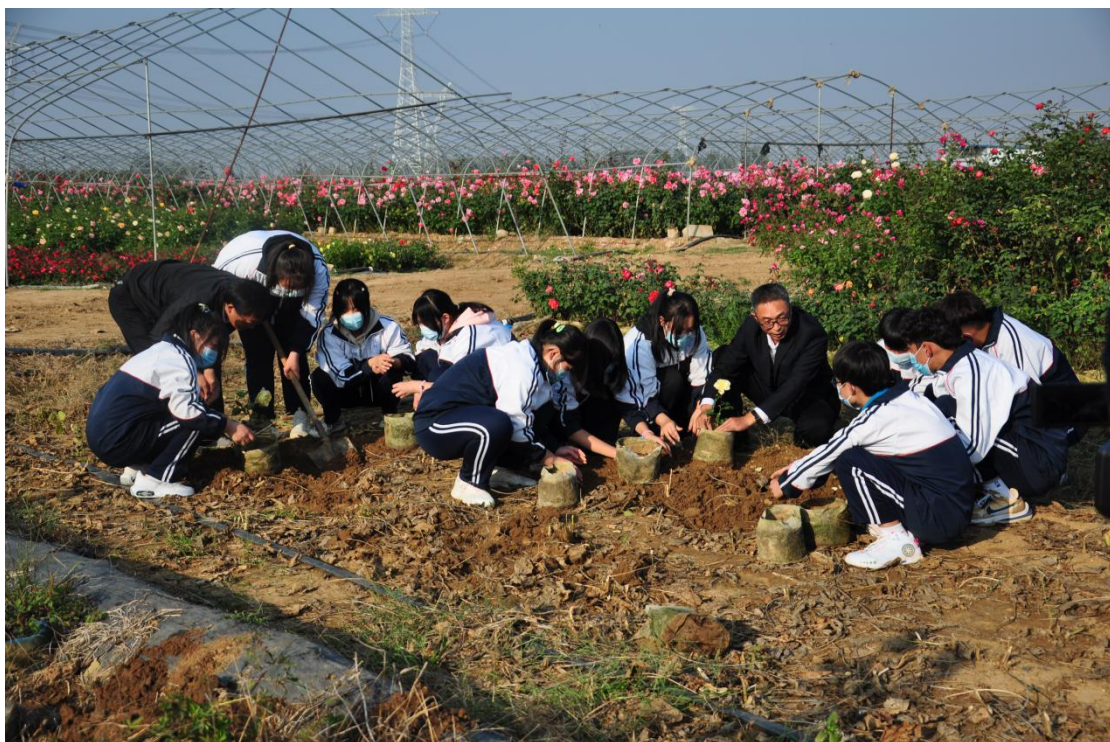
南阳第三中等职业学校园艺专业实习实训基地