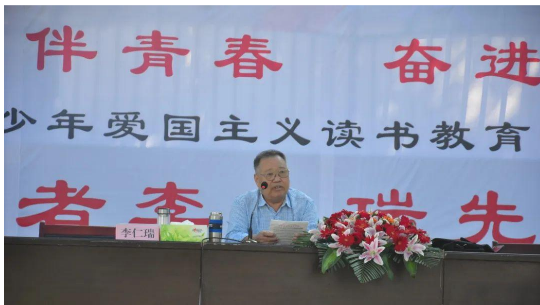
爱国主义读书教育活动