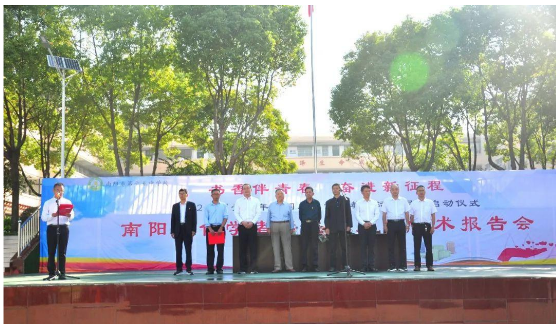
爱国主义读书教育活动

他们从中学会关爱，学会感恩，学会奉献。9月份，为增强学生爱国主义情怀，培育学生社会主义核心价值观，加强学生对南阳历史文化的了解，学校组织学生赴南阳市博物馆开展研学活动。开阔学生视野，全面提升学生的综合素质。10月份，开展了以“红心永向党，颂歌新时代”活动，使每一名学生深刻体会到新时代所肩负的历史使命，坚定了为实现国家富强、民族复兴、人民幸福的伟大“中国梦”而发奋学习、不懈奋斗的信念。