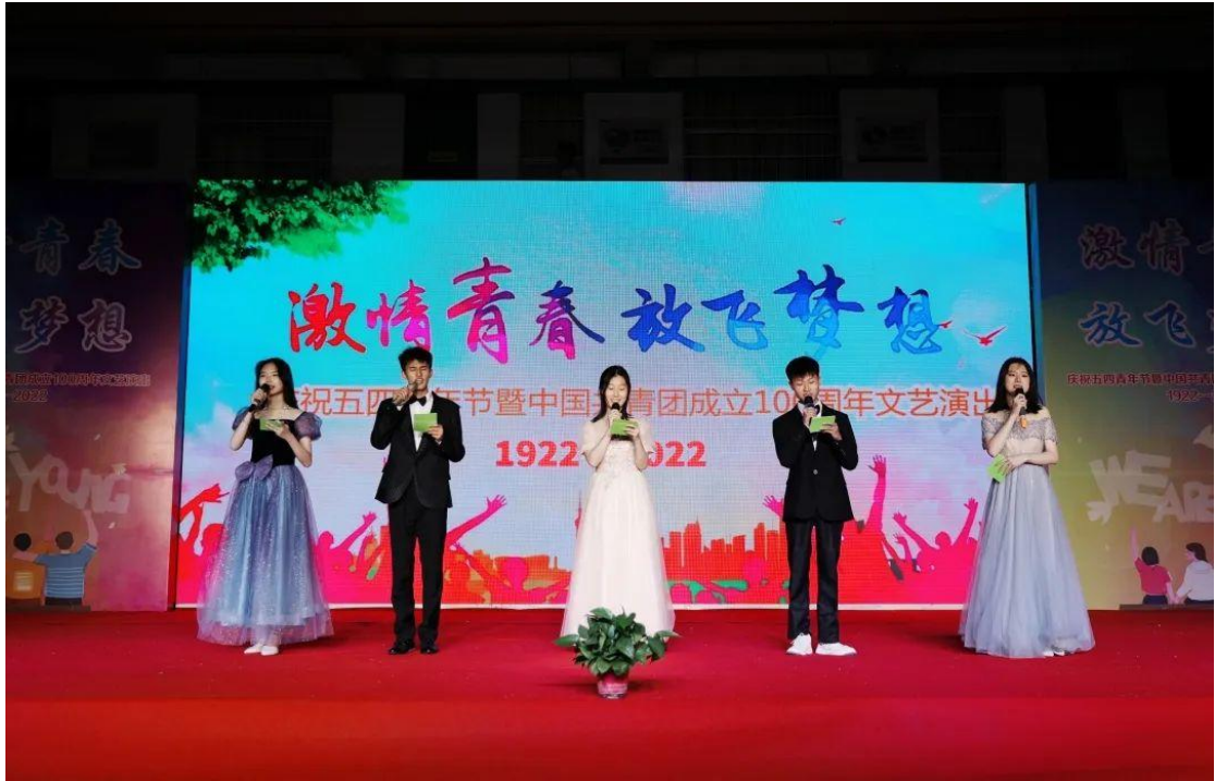
五四青年节文艺汇演