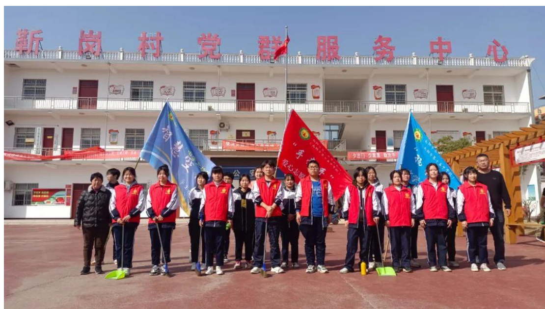
环境卫生清洁志愿活动