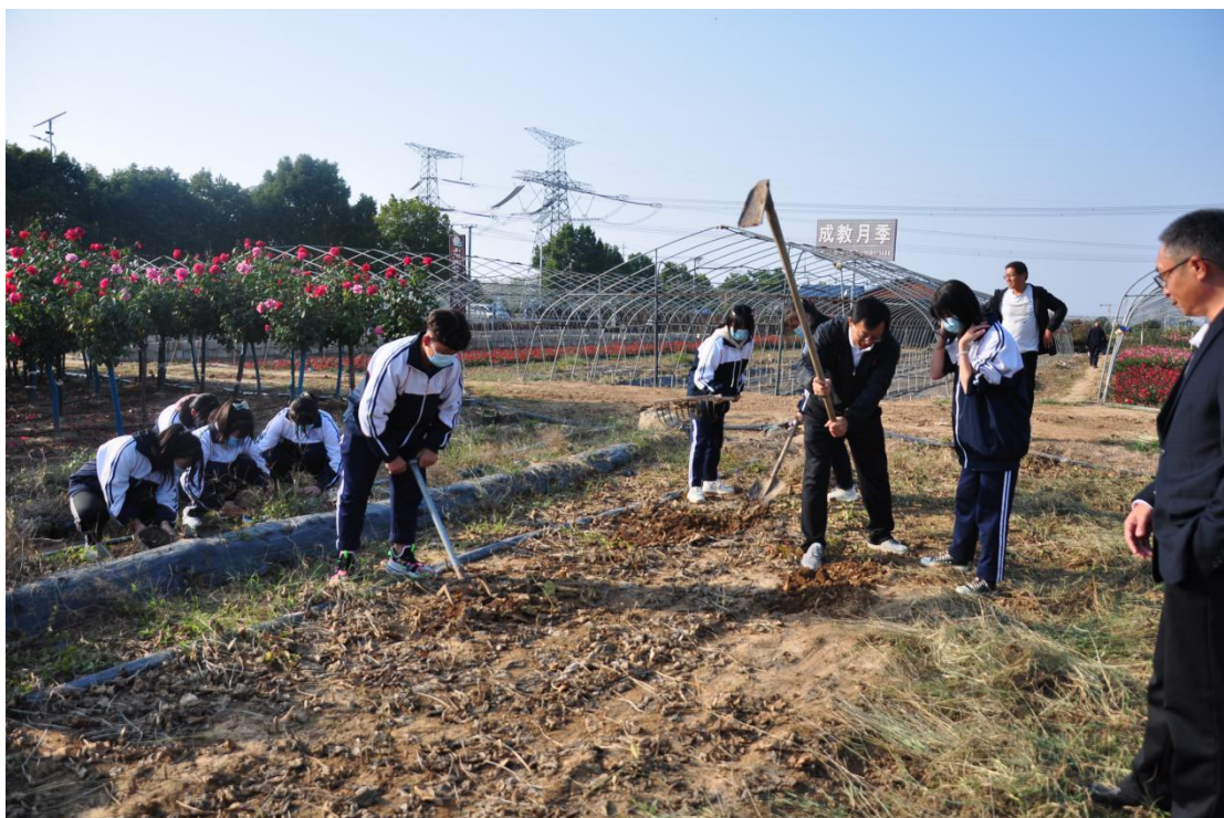
园艺专业实习实训