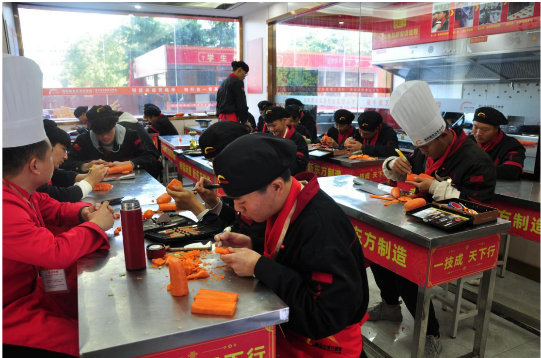
南阳第三中等职业学校烹饪专业实习实训基地