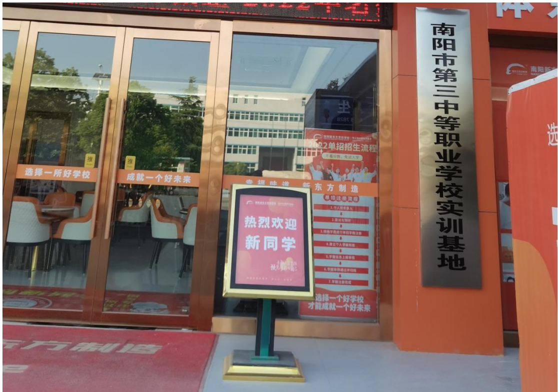
南阳第三中等职业学校烹饪专业实习实训基地