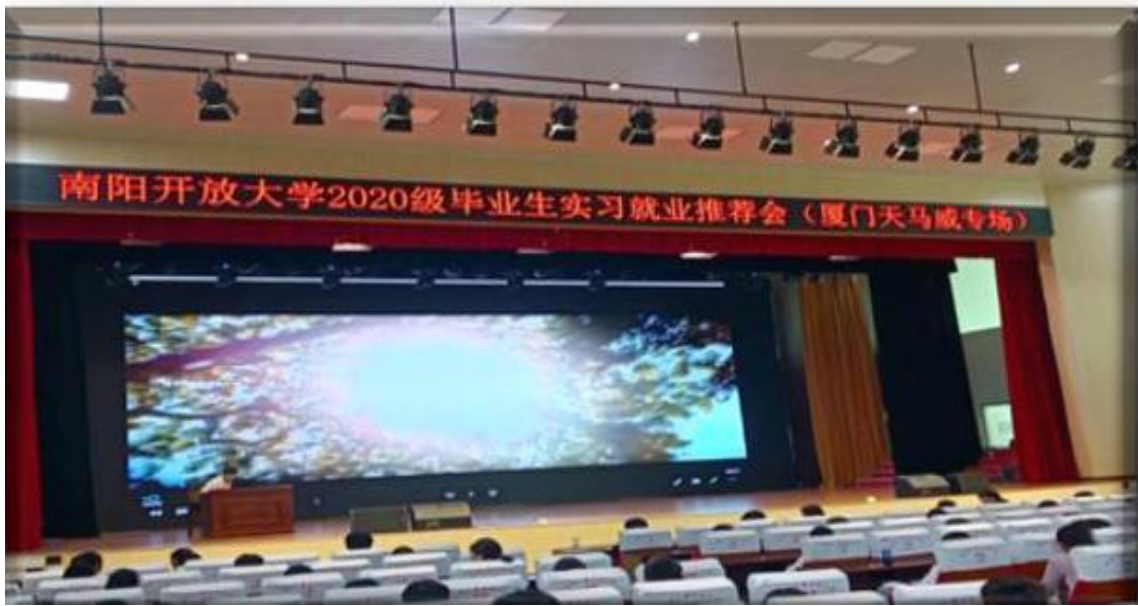
毕业生推荐会（厦门天马威专场）