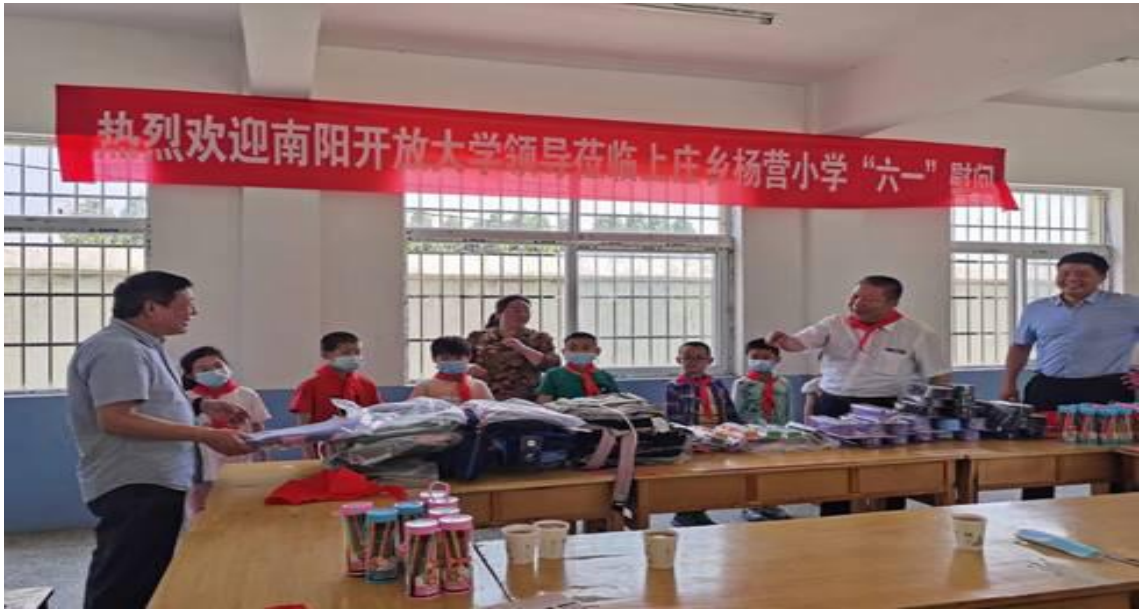
新野县上庄乡爱心捐赠