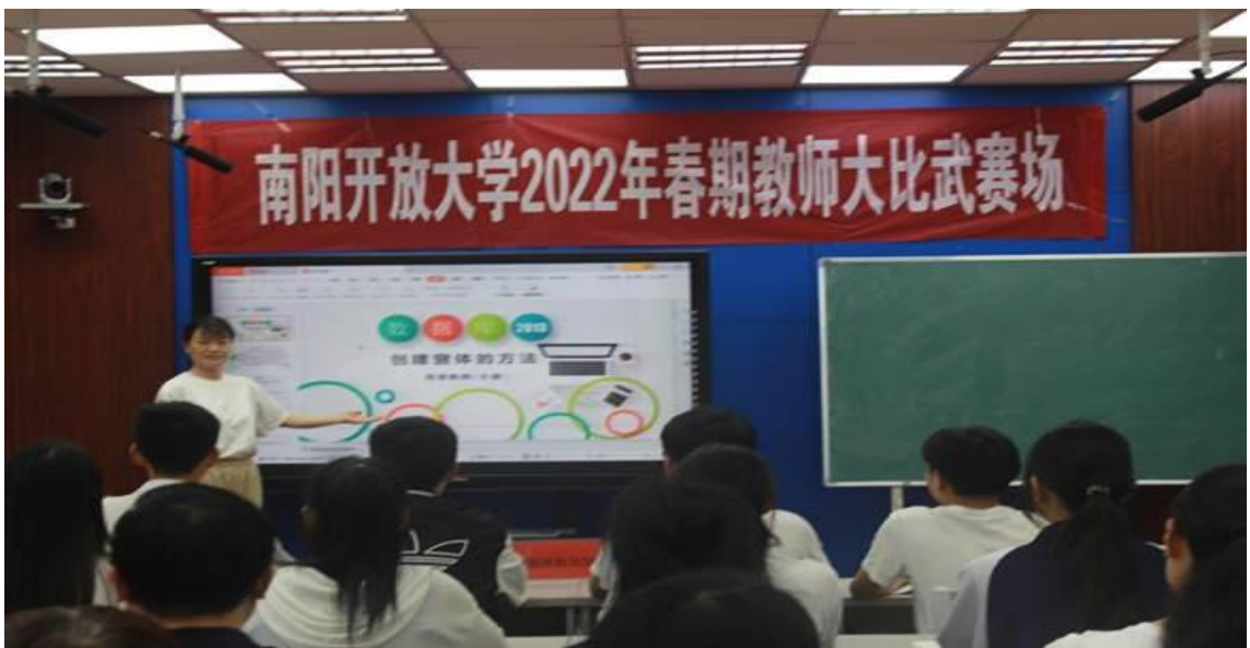
南阳开放大学 2022 年教师大比武

线上培训等。落实省教育厅的师资培训任务，选派 1 名教师参加“双师型”培训，1 名教师参加思政课国培、7 名教师参加省培。四是挖内潜。鼓励学校有专业技术职称的教职工承担中专教学工作，支持专业技术人员开展教研科研。搞好教师业务档案规范化建设，组织好教师年终综合业务考核，以考核促进教师整体素质的提升。