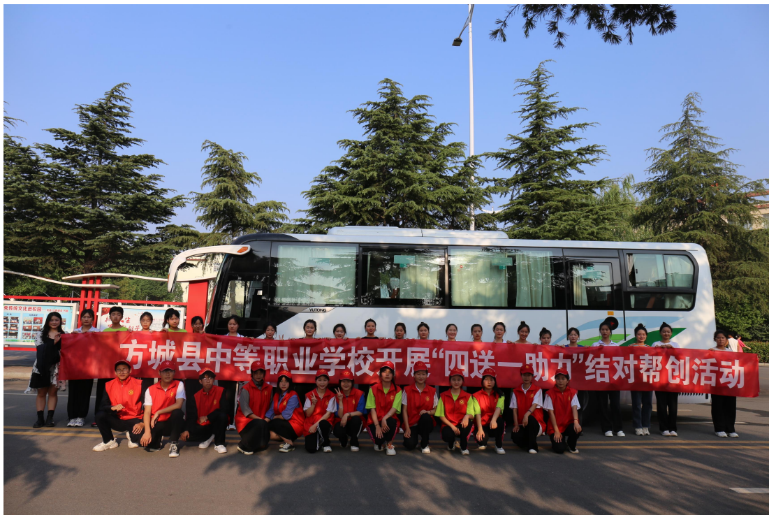
2022年5月学校到小史店镇刘庄小学开展“四送一助力”结对帮创活动。