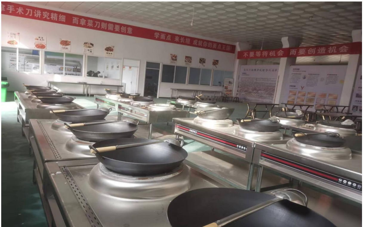
中餐烹饪专业实训室