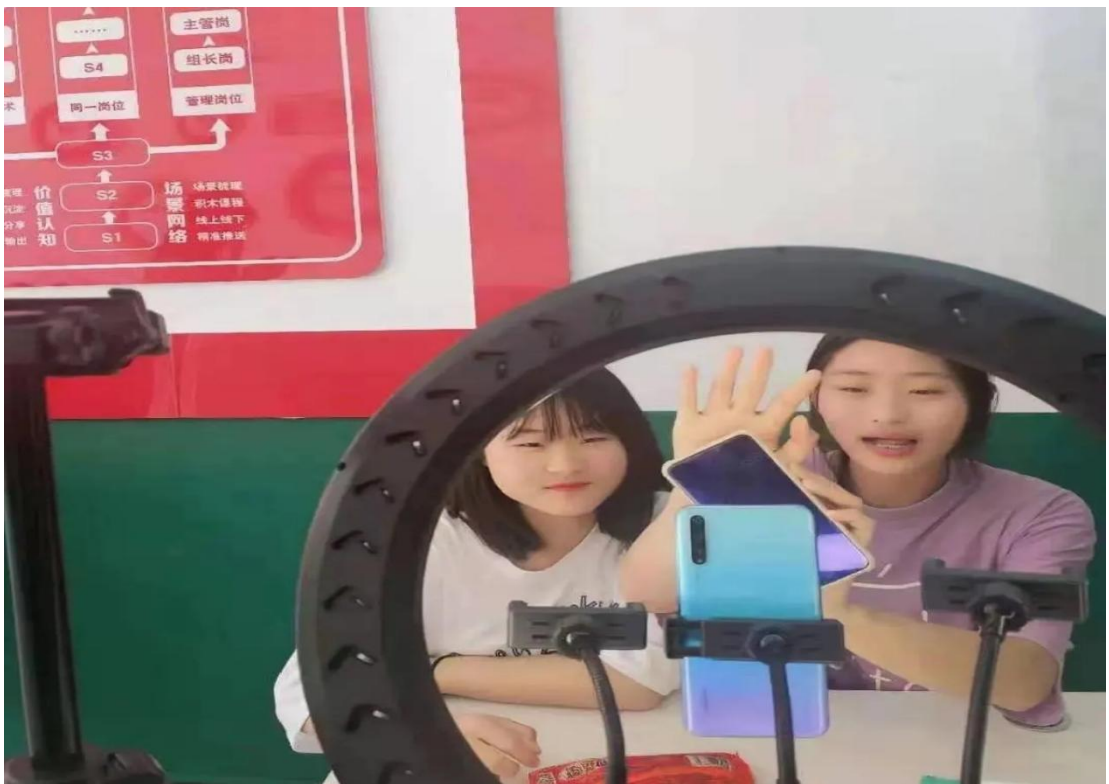
电商专业实训中心