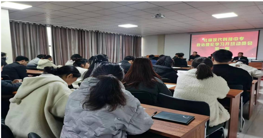
党员教师政治理论学习