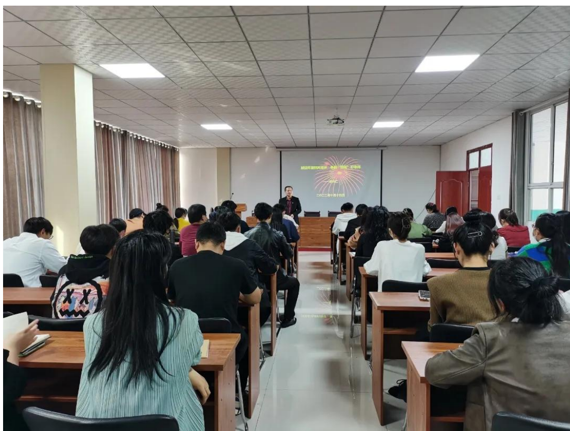
教师理论学习培训

教师、教学名师的培养工作。根据教师培养的不同目标层次，学校分级分层次实施师资培训，构建“请进来、送出去、传帮带”师资培养通道，积极选送教师到高校、企业参加各种学习和培训。2022年度，学校针对年轻教师占多数，教学经验普遍不足，学校大力开展校本多元化培训。在校本培训中，采用了“三结合”的方式：即通识培训与专题培训相结合，自学培训与检测培训相结合，外出培训与自我提高相结合。学校鼓励骨干教师和年轻教师结成“师徒”对子，以老带新。收到了良好效果，有效的促进了教师成长。