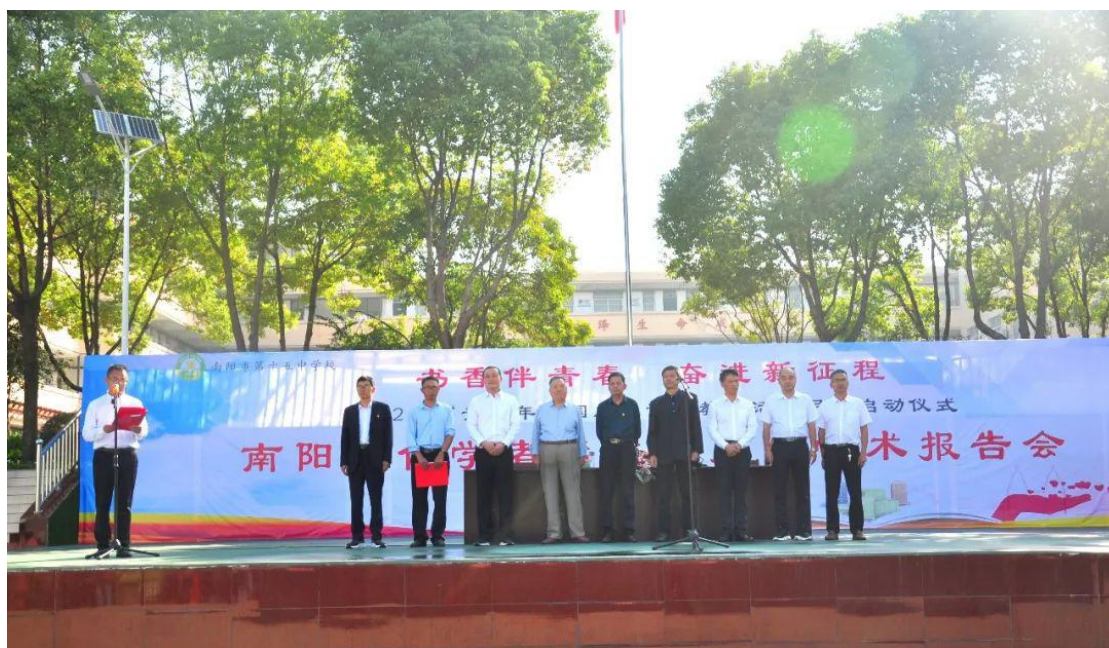
爱国主义读书教育活动

他们从中学会关爱，学会感恩，学会奉献。9月份，为增强学生爱国主义情怀，培育学生社会主义核心价值观，加强学生对南阳历史文化的了解，学校组织学生赴南阳市博物馆开展研学活动。开阔学生视野，全面提升学生的综合素质。10月份，开展了以“红心永向党，颂歌新时代”活动，使每一名学生深刻体会到新时代所肩负的历史使命，坚定了为实现国家富强、民族复兴、人民幸福的伟大“中国梦”而发奋学习、不懈奋斗的信念。