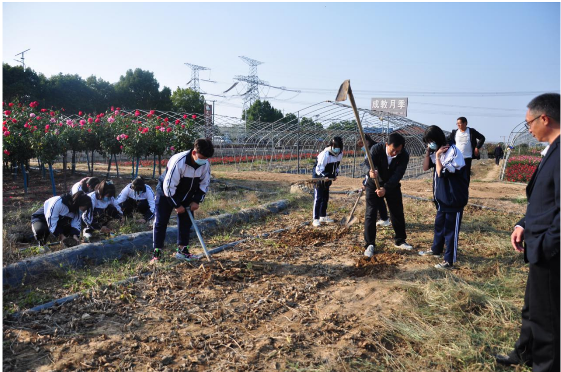
园艺专业实习实训