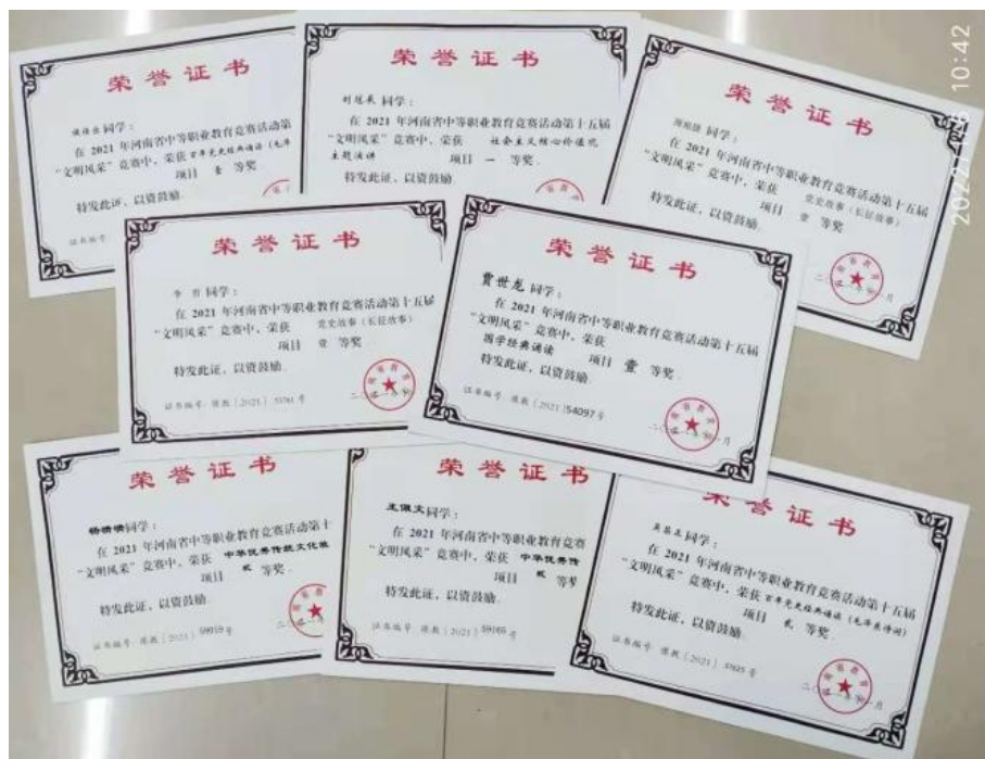
参加河南省第十五届中职院校“文明风采”大赛获奖证书