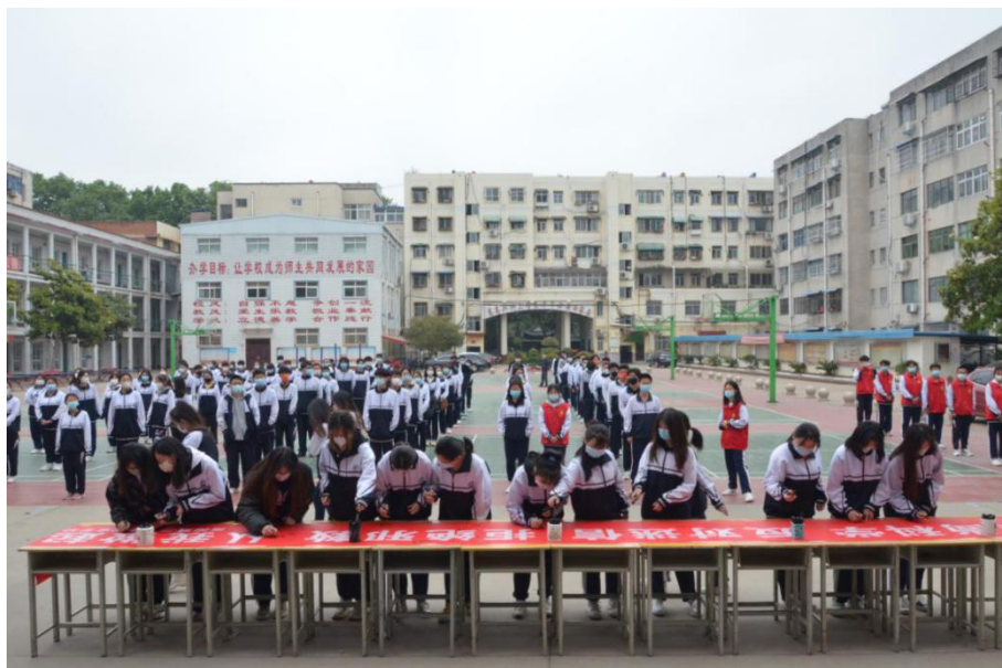
崇尚科学 反对迷信签字仪式

今年秋期南阳二职校对文明班级工作提出了新的要求，根据要求及时调整工作思路，调整计划，加大工作力度，采取的措施收效明显。违纪学生明显减少，课堂纪律也明显提高。违纪可耻，守纪光荣，已成为学生的自觉行动。