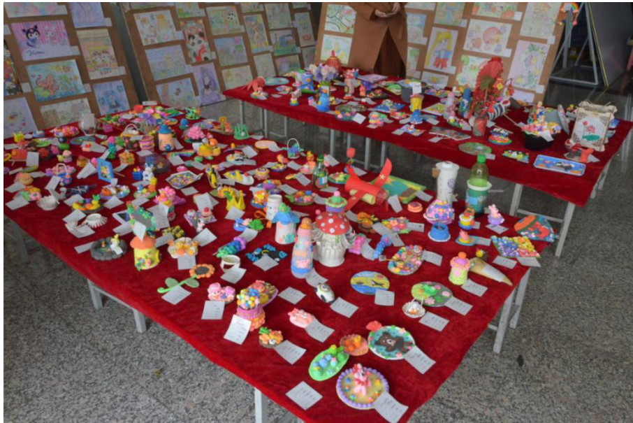
幼儿保育专业手工作品展