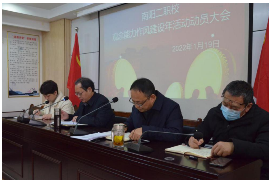
观念能力作风建设年活动动员大会