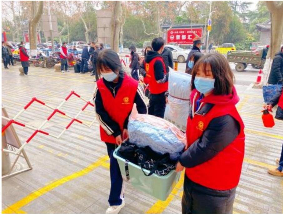
志愿者帮助新生搬运物品