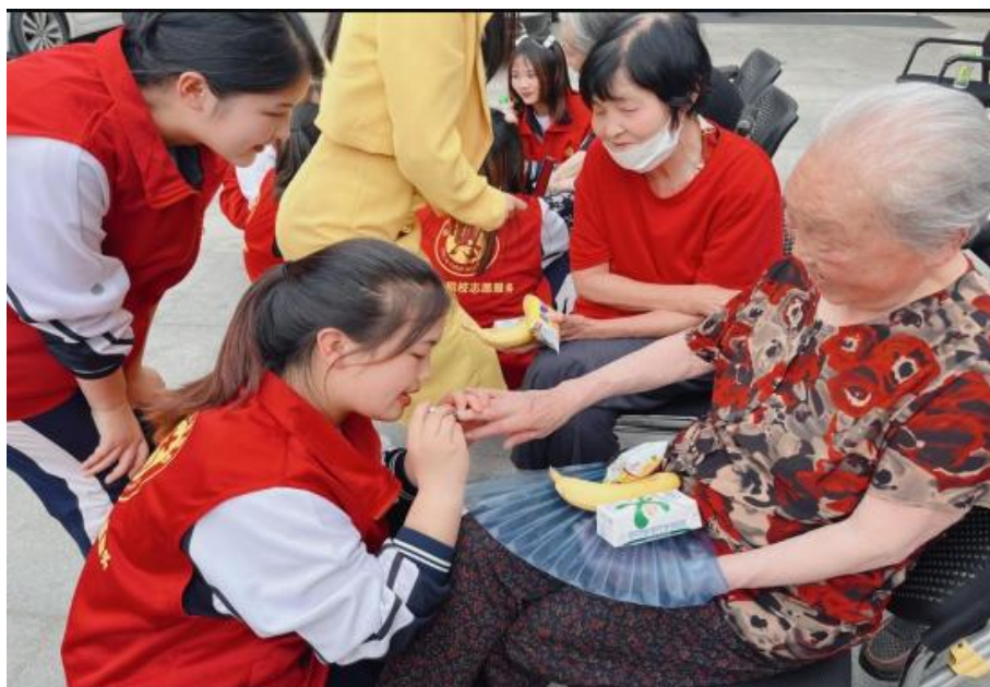
志愿者开展社区服务活动