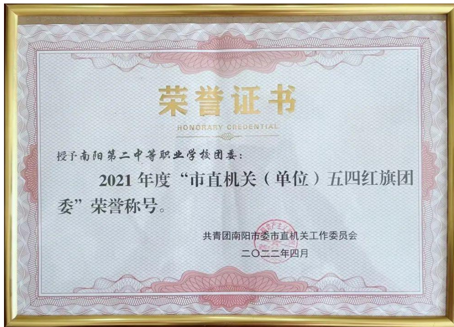
校团委被授予 2021 年度“市直机关（单位）五四红旗团委”荣誉称号