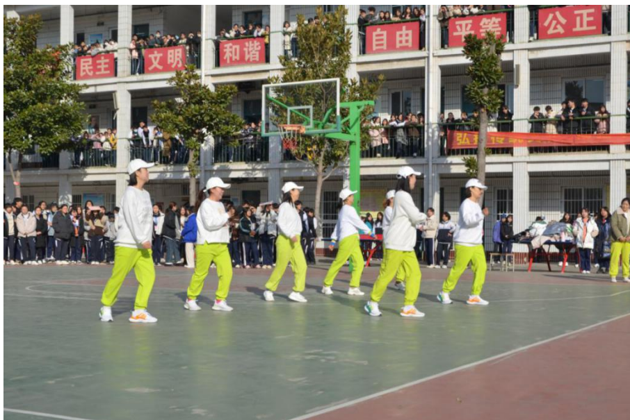
南阳市小炫风舞团入校教授曳步舞