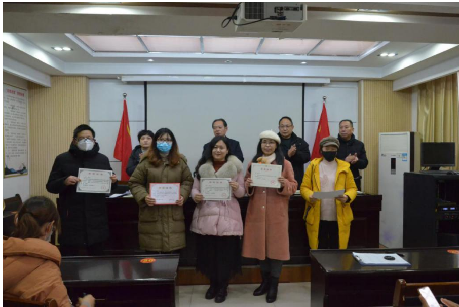
学校奖励教学成绩突出的教师