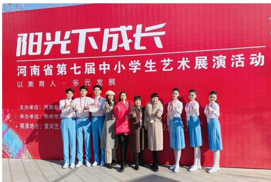
师生参加河南省第七届中小学生艺术展演活动

南阳二职校充分利用省市级职业院校技能大赛平台，将比赛项目引入培养方案、比赛内容引入课堂、比赛评价标准引入教学评价，出台了师生参加技能大赛激励方案，在技能实践教学围绕技能大赛进行各专业、各年级全员化训练，在 2022 年南阳市中等职业教育技能大赛中获得 3 个一等奖，5 个二等奖，3 个三等奖；在第八届南阳市中等职业学校学生素质能力大赛中获得 2 个一等奖，5 个二等奖，3 个三等奖；在第六届南阳市中等职业学校中华优秀传统文化大赛中获得 6 个一等奖，3 个二等奖，1 个三等奖。在 2022 年豫港澳姊妹学校朗诵比赛中获得一、二、三等奖各 1 个，优秀奖 4 个，南阳二职校获得组织奖。在第四届中华经典诵写讲大赛“诵读中国”经典诵读大赛，南阳二职校获得 4 个省级一等奖，目前 4 个项目全部进入国赛总决赛。