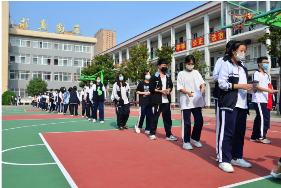
学生排队做核酸检测