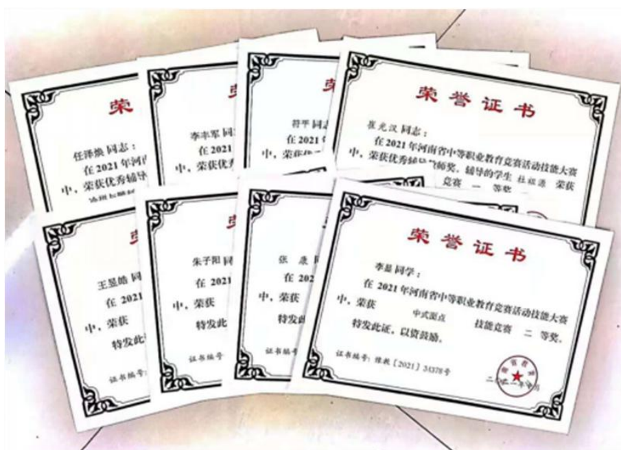
2021年河南省中等职业教育技能大赛南阳二职校获奖证书