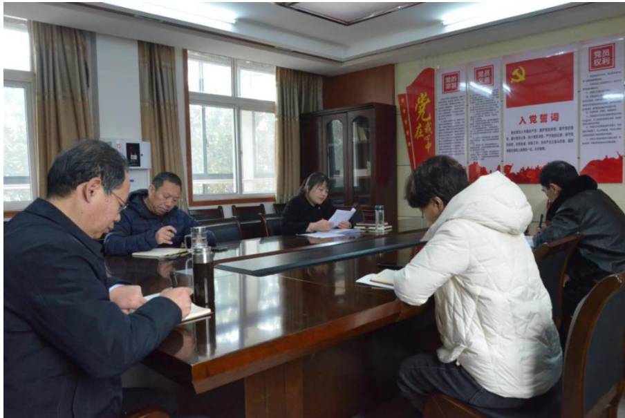
党总支进行集体学习