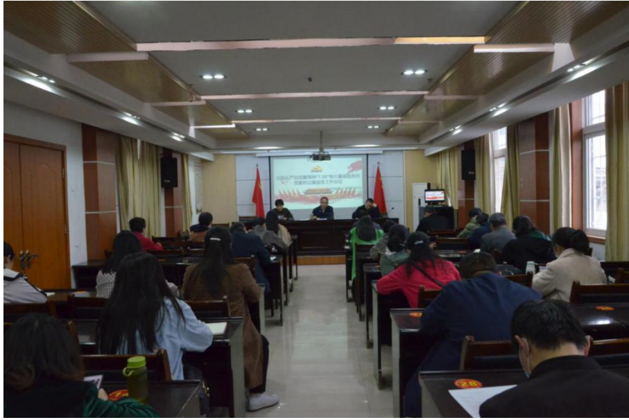
全面从严治党及“7.20特大暴雨追责问责以案促改”会议